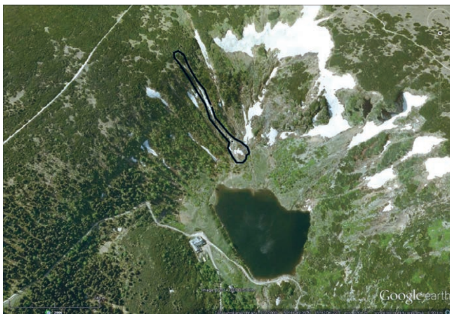
Ryc. 4. Kocioł Małego Stawu z zaznaczoną powierzchnią pomiarową Mały Staw Glacial Cirque with marked measuring site

W Kotle Małego Stawu pomiary lichenometryczne przeprowadzono na formie silnie przemodelowanej przez spływ w 1997 r. (ryc. 4). Pierwsze pomiary wykonano w 2011 r., następne w 2014. Różnica wielkości plech po upływie trzech lat była trudna do wychwycenia wskutek małego przyrostu plech i zróżnicowania tempa przyrostu, związanego między innymi z wysokością. Samo datowanie nie było ani precyzyjne, ani łatwe, ze względu na małą ilość plech. Oprócz roku 1997, w którym doszło do dużego przemodelowania formy, zaznaczyły się również zdarzenia z innych lat. Bardzo nieliczne stare plechy wydatowano na lata 1930., 1960. (prawdopodobnie 1964 r.) i 1980. W wymienionych okresach doszło do przemieszczenia się materiału w omawianej formie. Trudno dzisiaj ocenić jak duże były te przemieszczenia, ponieważ późniejsze zdarzenia, głównie spływ w 1997 r., zatarły wiele śladów. Najwięcej plech zachowało się z lat 1990. Część z nich prawdopodobnie jest zapisem przemieszczenia się materiału w roku 1994, natomiast reszta (większa część) pochodzi z materiału przemieszczonego w czasie dużego spływu w 1997 r. Wzdłuż całego profilu, ale głównie w dolnej części formy, wielokrotnie pomierzono plechy o średnicy około 6 mm, które można wiązać z niewielkimi przemieszczeniami materiału w 2006 r.