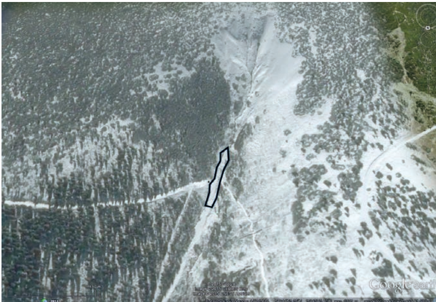
Ryc. 5. Biały Jar z zaznaczoną powierzchnią pomiarową Biały Jar with marked measuring site

W 1997 r. w Białym Jarze doszło do spływu gruzowego, który utworzył w dnie doliny duży stożek torencjalny o długości około 40 m i powierzchni około 300 m 2 (ryc. 5, Migoń i Parzóch, 2008). Obecnie spora część tej formy jest pokryta roślinnością, co uniemożliwia datowanie lichenometryczne. Na odsłoniętym materiale gruzowym w kilku miejscach występują plechy o średnicy około 10-11 mm, które uznano za zapis wspomnianego wyżej zdarzenia. Starsze plechy występują bardzo rzadko i ze względu na kształt oraz łączenie się plech odstąpiono od ich datowania. Nie udało się również znaleźć odpowiedniej liczby plech świadczących o przemieszczaniu się materiału w okresie późniejszym niż 1997 rok. Datowanie w niszy Białego Jaru było utrudnione nie tylko z powodu zarastania starszych form, lecz również ze względu na obecność wody potoku, która wpływa na tempo przyrostu plech.