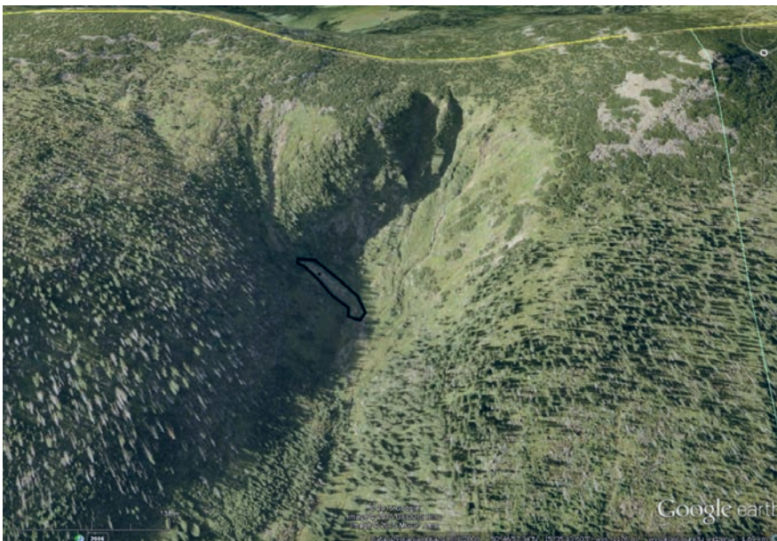
Ryc. 3. Czarny Kocioł Jagniątkowski z zaznaczoną powierzchnią pomiarową Czarny Jagniątkowski Glacial Cirque with marked measuring site

W Czarnym Kotle Jagniątkowskim, podobnie jak w Kotle Małego Stawu, datowanie lichenometryczne przeprowadzono na formie, która w ostatnim czasie najsilniej została przemodelowana przez spływ gruzowy w 1997 r. i właśnie z tego zdarzenia jest najwięcej plech o średnicy około 12 mm (ryc. 3). 10 plech o średnicy rzędu 35-40 mm zachowało się również z lat 1960., występują one głównie na wałach po obu stronach rynny. Na grzbietach tych wałów i po ich zewnętrznej stronie znaleziono kilka dużych plech o średnicy 60-65 mm, które przypuszczalnie pochodzą z drugiej lub trzeciej dekady XX w., czyli końca małej epoki lodowej. Forma ta powstała więc najpóźniej pod koniec małego gólcjału i została przemodelowana zapewne w 1964 r. przez niewielki spływ gruzowy, a następnie mocno zmieniona przez spływ w 1997 r. W środkowej części rynny znaleziono, podobnie jak w Kotle Małego Stawu, kilka plech o średnicy rzędu 6-7 mm, odpowiadającej początkowi XXI w., które prawdopodobnie są zapisem niewielkiego przemieszczenia się materiału w dnie rynny w roku 2006.