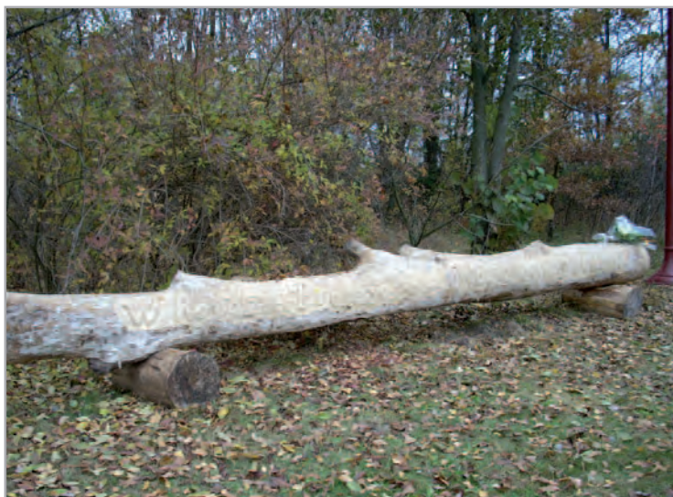
Napis przy pomniku Leszka Kołakowskiego w Petrykozach, 23 października 2007.