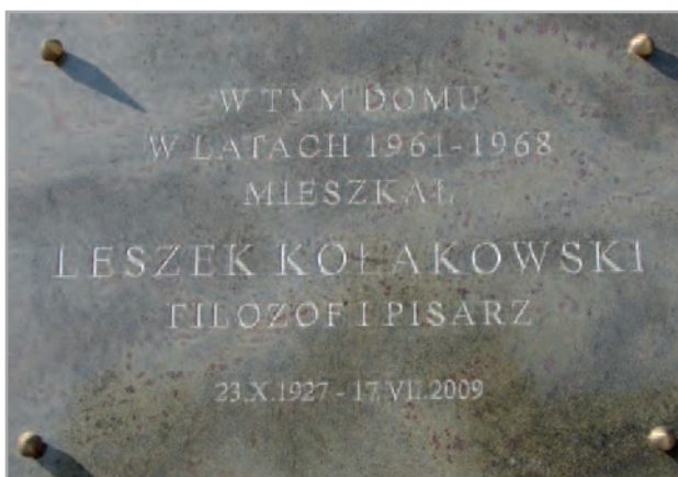
Tablica przy ulicy Senatorskiej 40 w Warszawie.