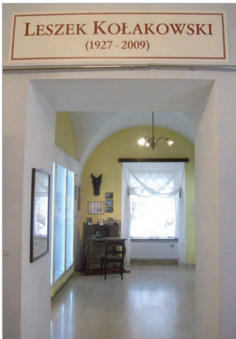
Wejście do Gabinetu Leszka Kołakowskiego w Muzeum im. Jacka Malczewskiego w Radomiu.