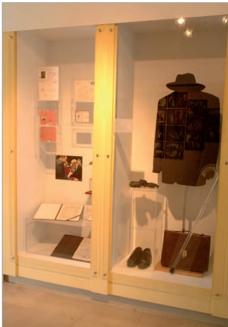
Gabinet Leszka Kołakowskiego w Muzeum im. Jacka Malczewskiego w Radomiu.