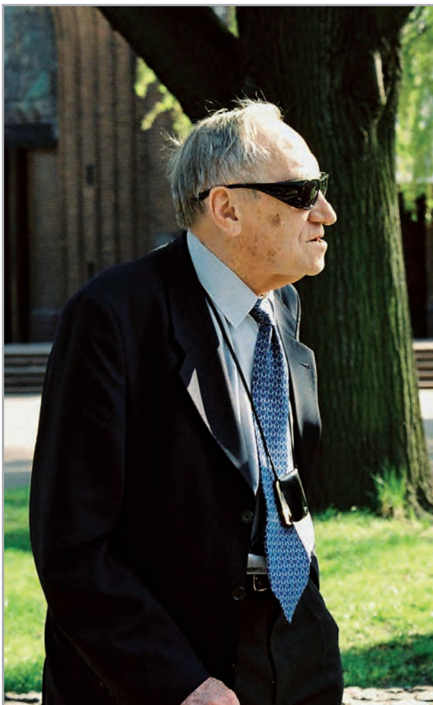
Leszek Kołakowski przed Katedrą Opieki Najświętszej Marii Panny w Radomiu, 2 maja 2005.