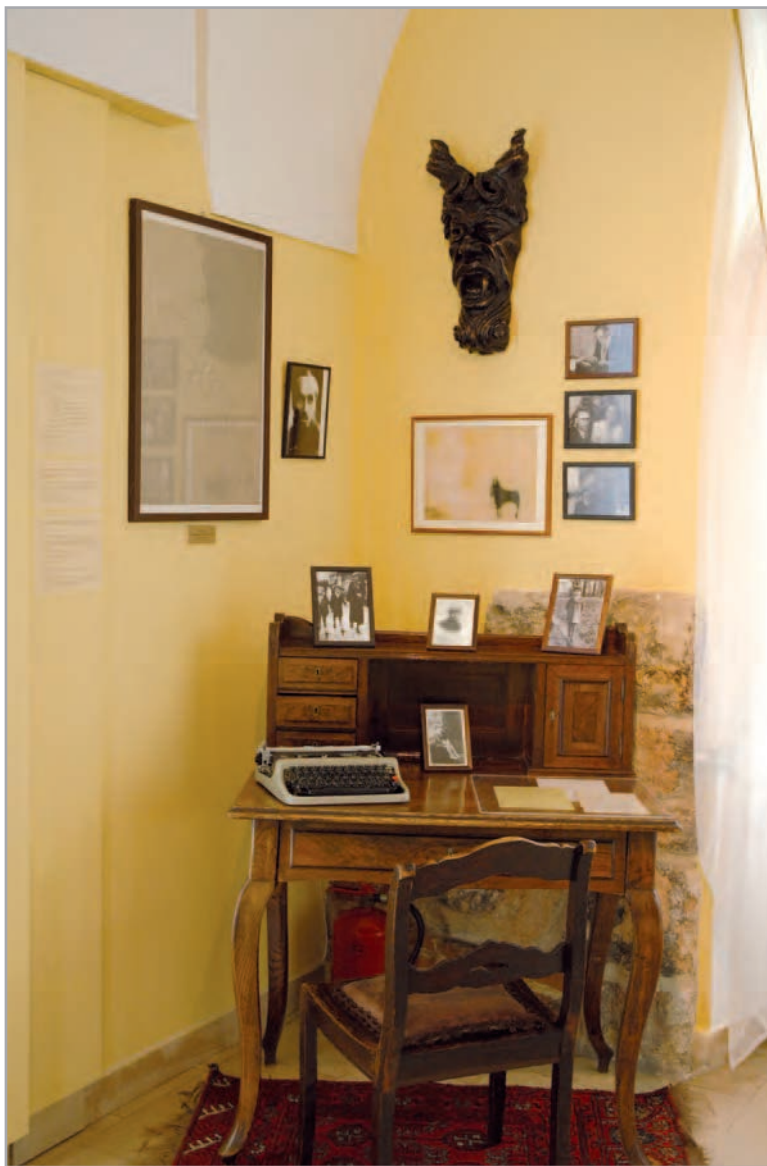
Gabinet Leszka Kołakowskiego w Muzeum im. Jacka Malczewskiego w Radomiu.