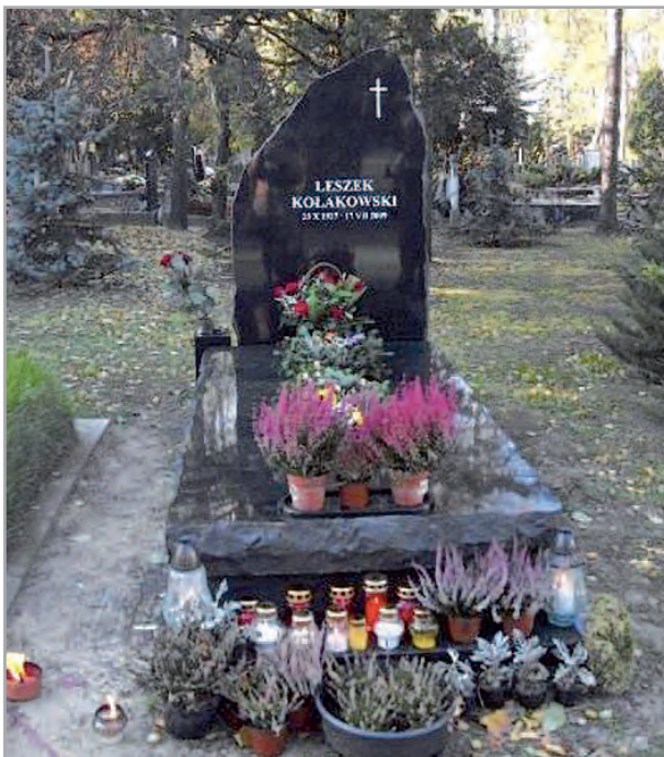
Grób Leszka Kołakowskiego na Cmentarzu Powązkowskim w Warszawie.