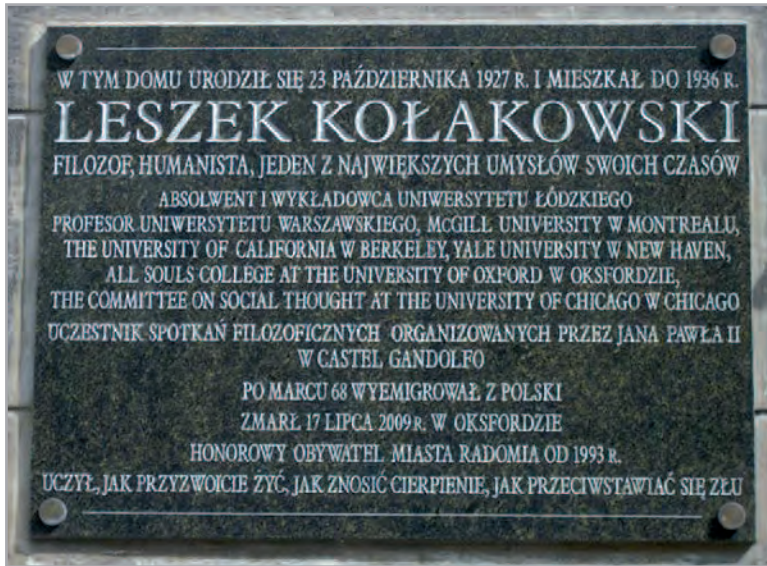
Tablica przy ulicy Niedziałkowskiego 26 w Radomiu.