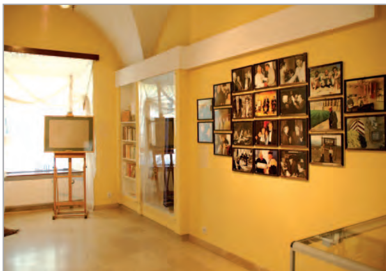
Gabinet Leszka Kołakowskiego w Muzeum im. Jacka Malczewskiego w Radomiu.