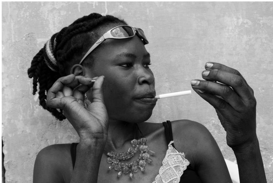
Migrantka z Ugandy. Dżuba 2007.