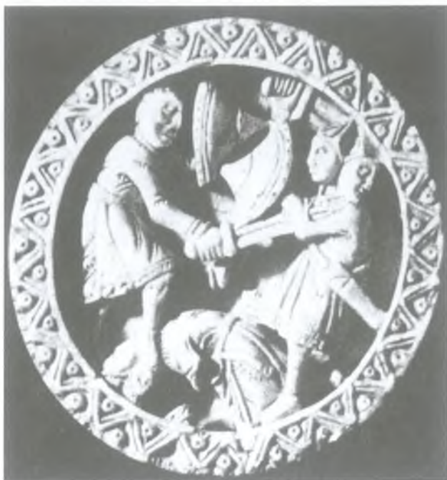
Ryc. 10. Pion do gier z przedstawieniem Herkulesa walczącego z Gerionem, warsztat koloński, połowa XII w. (wg Mann 1983, fig. 17)

Fig. 10. Ivory gaming pawn with the image of Hercules battling Gerion, workshop in Cologne, half of the 12th century (after Mann 1983, fig. 17)