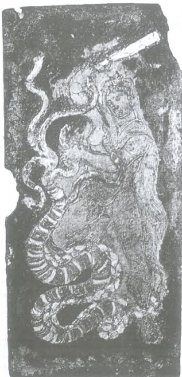
Fig. 2. Hercules and Hydra. Bronze plaque from the 4th century (?) (after Weitzmann 1973, fig. 48)