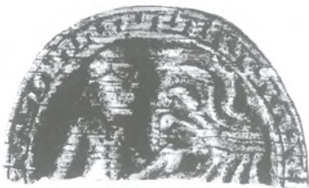
Ryc. 1. Krążek z kości słoniowej z Ostrowa Tumskiego we Wrocławiu

wie proporcji wyobrażenia można jednak przypuszczać, że postać trzyma w prawej ręce jakiś przedmiot, który styka się z dłonią lewej ręki oraz ze stworzeniem widocznym z prawej strony krążka. Stwór