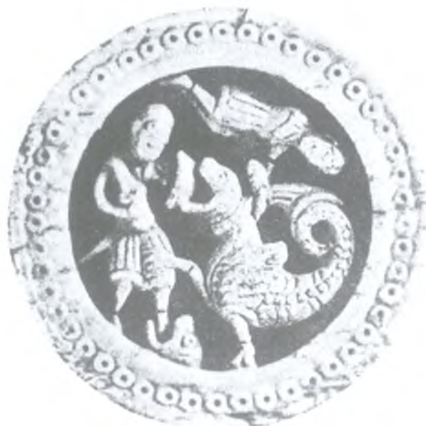
Ryc. 9. Pion do gier w przedstawieniu Herkulesa walczącego z Hydram (?), warsztat przy klasztorze Św. Marcina w Tournai, połowa XII w. (wg Goldschmidt 1923, Taf. LV, nr 212)

Fig. 8. Ivory gaming pawn with the image of Hercules battling the Lernean Hydra (?), workshop near St. Martin monastery in Tournai, half of the 12th century (after Goldschmidt 1923, Taf. LV, no. 213)