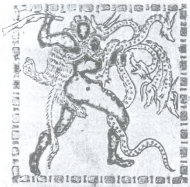
Ryc. 6. Plakietka z kości słoniowej na tronie Karola Łysego, tzw. Cathedra Petri z IX w. (wg Weitzmann 1973, fig. 8)

Fig. 5. Hercules and Hydra. Fragment of the Coptic textile from the 7th century (after Weitzmann 1973, fig. 9)