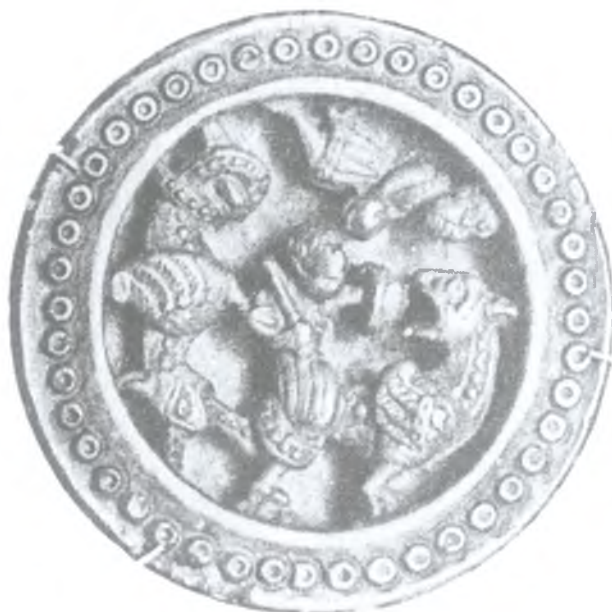
Ryc. 8. Pion do gier z przedstawieniem Herkulesa walczącego z Hydram (?), warsztat przy klasztorze Św. Marcina w Tournai, połowa XII w. (wg Goldschmidt 1923, Taf. LV, nr 213)

Fig. 8. Ivory gaming pawn with the image of Hercules battling the Lernean Hydra (?), workshop near St. Martin monastery in Tournai, half of the 12th century (after Goldschmidt 1923, Taf. LV, no. 213)