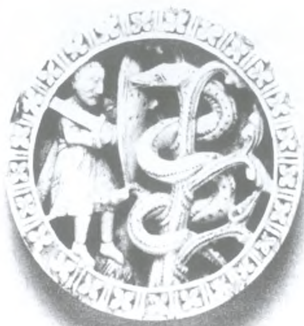
Ryc. 11. Pion do gier z przedstawieniem Herkulesa walczącego ze smokiem w ogrodzie Hesperyd, warsztat koloński, połowa XII w. (wg Mann 1983, fig. 19)

Fig. 10. Ivory gaming pawn with the image of Hercules battling Gerion, workshop in Cologne, half of the 12th century (after Mann 1983, fig. 17)