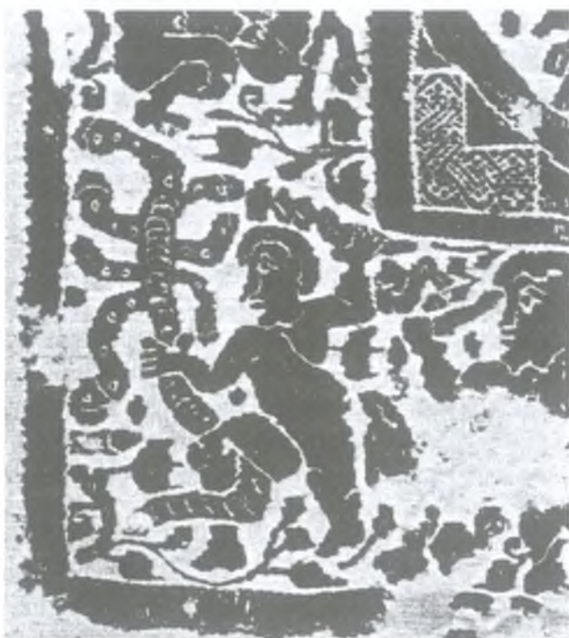
Ryc. 5. Herkules i Hydra. Fragment tkaniny koptyjskiej z VII w. (wg Weitzmann 1973, fig. 9)

Fig. 5. Hercules and Hydra. Fragment of the Coptic textile from the 7th century (after Weitzmann 1973, fig. 9)