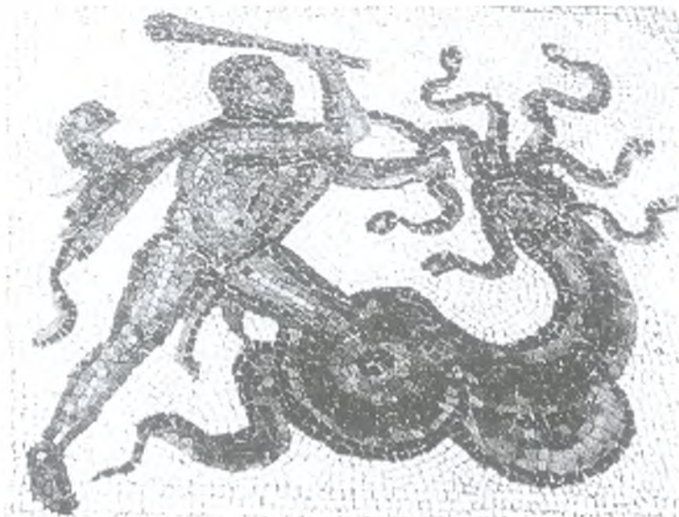
Ryc. 4. Herkules i Hydra – fragment mozaiki z Lirii z III w. (wg Weitzmann 1973, fig. 19)

W przypadku krążka z Ostrowa Tumskiego dolna część nie zachowała się i trudno jednoznacznie stwierdzić, czy postać jest uzbrojona. Odkrywczy zabytku uznali, że ręką dotyka ona bezpośrednio zwierzęcia, tymczasem z proporcji postaci wynika raczej, że trzyma ona jakiś przedmiot. Niewykluczone, że jest to maczuga lub płonąca żagiew, choć nie można też wykluczyć, że jest to miecz, co biorąc pod uwagę uwspółcześnianie przez średnio-wiecznych wytwórców opracowywanych przez nich