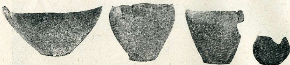
Ryc. 3 Gródek Nadbużny, pow. Hrubieszów. Grób nr 2 (podwójny) ceramika