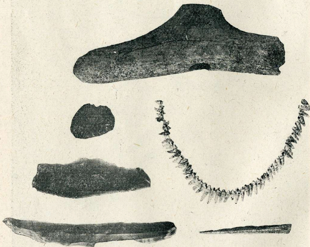
Ryc. 4. Gródek Nadbużny, pow. Hrubieszów. Grób nr 2 (podwójny). Wiory krzemienne, naszyjnik z muszelek, szydełko kościane i topór rogowy