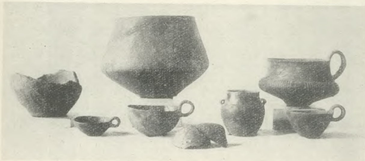
Ryc. 4. Księginice Wielkie, pow. dzierzoniowski. Zestaw naczyń, które znajdowały się w zbiorach tamtejszej szkoły