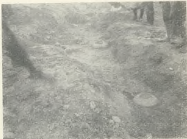
Ryc. 8. Księginice Wielkie, pow. dzierzoniowski. Grób nr 8