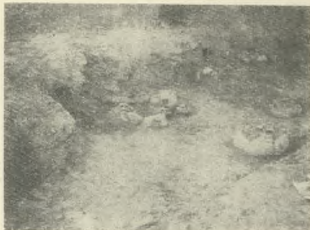
Ryc. 6. Księginice Wielkie, pow. dzierzoniowski. Odsłonięte groby nr. 2—6