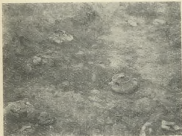
Ryc. 5. Księginice Wielkie, pow. dzierzoniowski. Odsłonięte groby nr. 1—6