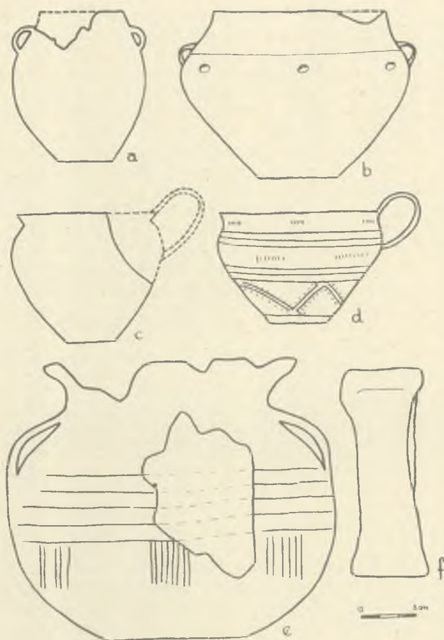
Ryc. 3. Księginice Wielkie, pow. dzierzoniowski. a—c — grób nr 11; d — grób nr 12; e — grób nr 14; f — znalezisko luźne