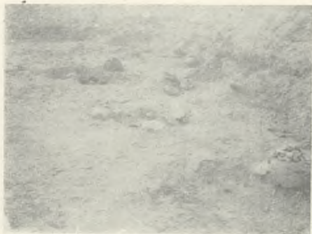
Ryc. 7. Księginice Wielkie, pow. dzierzoniowski. Odsłonięte groby nr. 10—17