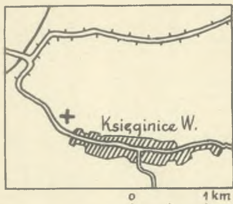
Ryc. 1. Księginice Wielkie, pow. dzierzoniowski. Położenie cmentarzyska (+)

Kończąc te wstępne uwagi, należy jeszcze wspomnieć, że istnieje w różnych zeszytach „Altschlesische Blätter” szereg wzmianek o znajdowaniu ceramiki z epoki brązu w Księ-