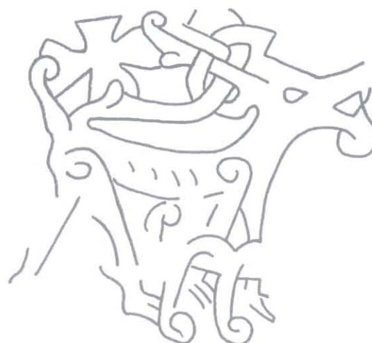
Ryc. 8. Ornament na kamieniu z Tumbo, Södermanland, początek XI wieku. Rys. P. Kulesza, za: Södermanlands runinskrifter... , nr kat. 82

Fig. 7. The ornamentation on the stone from Tullstorp, Skania, the 10 th - 11 th century. Drawing by P. Kulesza, after: DR, cat. no. DR 271