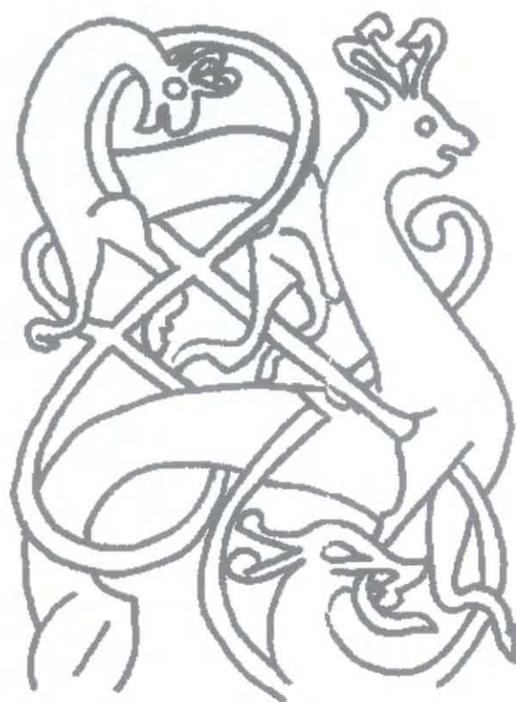
Ryc. 11b. Ornamentyka na kamieniu z Resmo, Olandia, XI wiek. Rys. P. Kulesza, za: Öl. , nr kat. 4

Fig. 11a. The ornamentation on the stone from Väppeby, Uppland, the middle of the 11 th century. Drawing by P. Kulesza, after: Upplands runinskrifter... , cat. no. 692