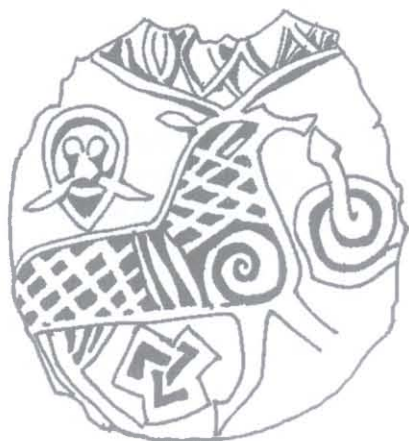
Ryc. 2. Moneta z wizerunkiem walczącego jelenia, Hedeby, połowa IX wieku. Rys. P. Kulesza

Fig. 2. The coin with the image of the struggling deer, Hedeby, the middle of the 9 th century. Drawing by P. Kulesza