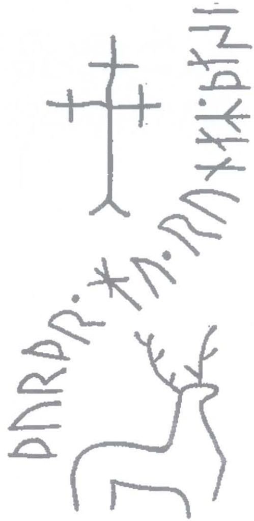
Ryc. 6. Ornamentyka na kamieniu z Hyby, Skania, X wiek. Rys. P. Kulesza, za: DR, nr kat. 264 Fig. 6. The ornamentation on the stone from Hyby, Skania, the 10 th century. Drawing by P. Kulesza, after: DR, cat. no. 264

cyfiksy, które można było postawić na kamiennym ołtarzu (Lager 2002, 154-155, fig. 75). Być może to właśnie bezpośrednia kontrola misjonarza nad opracowaniem ornamentyki pomników w Hyby i Glenstrup zadecydowała o „europejskiej” formie tych jeleni.