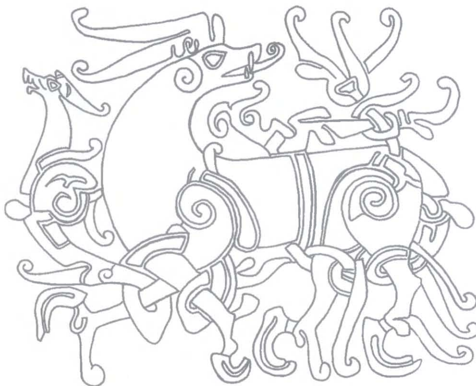
Ryc. 10. Ornament na płycie kamiennej z kościoła św. Pawła w Londynie, 1. połowa XI wieku. Rys. P. Kulesza Fig. 10. The ornamentation on a stone slab from the St Paul's Church in London, the 1 st half of the 11 th century. Drawing by P. Kulesza

11a i 11b, ten ostatni z Olandii). Dystrybucja tego ornamentu właśnie w tej części dzielnicy łączy się prawdopodobnie z sytuacją polityczną tego rejonu.