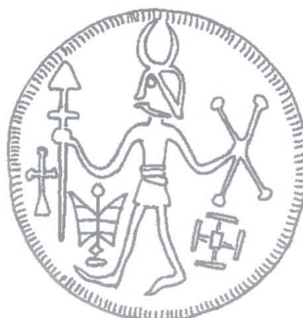
Ryc. 3. Moneta z Hedeby, połowa IX w. Rys. P. Kulesza

Fig. 2. The coin with the image of the struggling deer, Hedeby, the middle of the 9 th century. Drawing by P. Kulesza