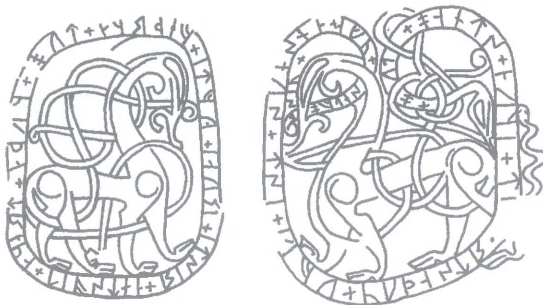
Ryc. 12. Ornamentyka na kamieniach z Norrby, Uppland, połowa XI wieku. Rys. P. Kulesza, za: Upplands runinskrifter... , nr kat. 766, 767