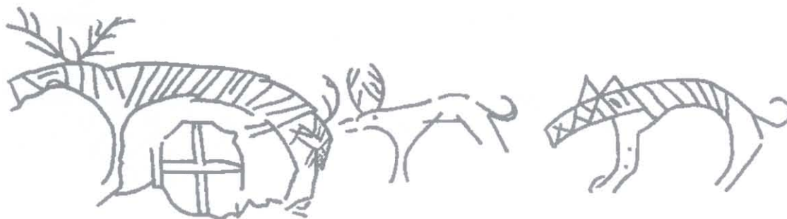
Ryc. 1. Zwierzęta wryte na kościanej okładzinie z Ribe, połowa VIII wieku. Rys. P. Kulesza