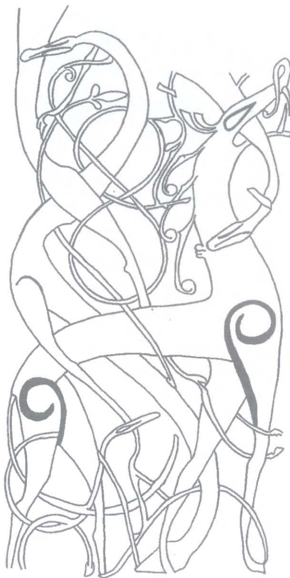
Ryc. 13. Fragment zdobienia zachodniego portalu drewnianego kościoła w Urnes, Norwegia, 2. połowa XI wieku. Rys. P. Kulesza