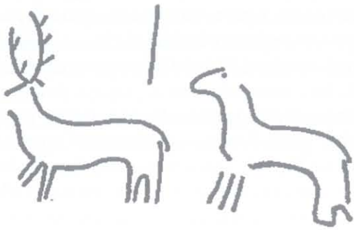
Ryc. 5. Ornamentyka na kamieniu z Glenstrup, Jutlandia, X wiek. Rys. P. Kulesza, za: DR, nr kat. 123 Fig. 5. The ornamentation on the stone from Glenstrup, Jutlandia, the 10 th century. Drawing by P. Kulesza, after: DR, cat. no. 123