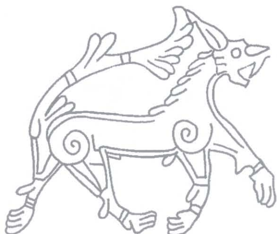
Ryc. 7. Ornamentyka na kamieniu z Tullstorp, Skania, X-XI wiek. Rys. P. Kulesza, za: DR, nr kat. DR 271

Fig. 7. The ornamentation on the stone from Tullstorp, Skania, the 10 th - 11 th century. Drawing by P. Kulesza, after: DR, cat. no. DR 271