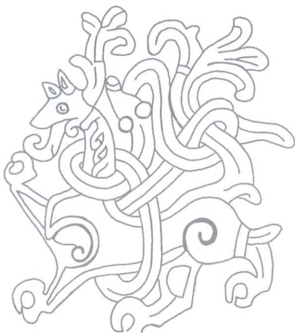
Ryc. 4. Fragment ornamentyki kamienia Haralda z Jelling, 2. połowa X wieku. Rys. P. Kulesza, za: DR, nr kat. 42

Fig. 4. A fragment of the ornamentation on the Harald's Stone from Jelling, the 2 nd half of the 10 th century. Drawing by P. Kulesza, after: DR, cat. no. 42