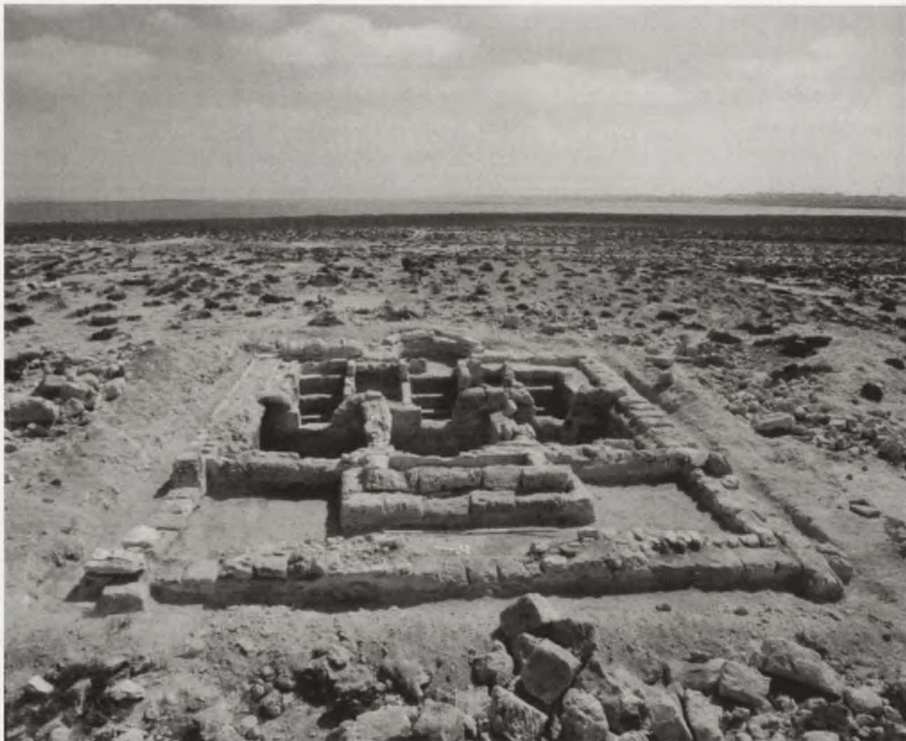
Ryc. 4. Pozostałości cmentarnej kaplicy z V w. odkrytej pod kierunkiem H. Szymańskiej w Marea w Egipcie