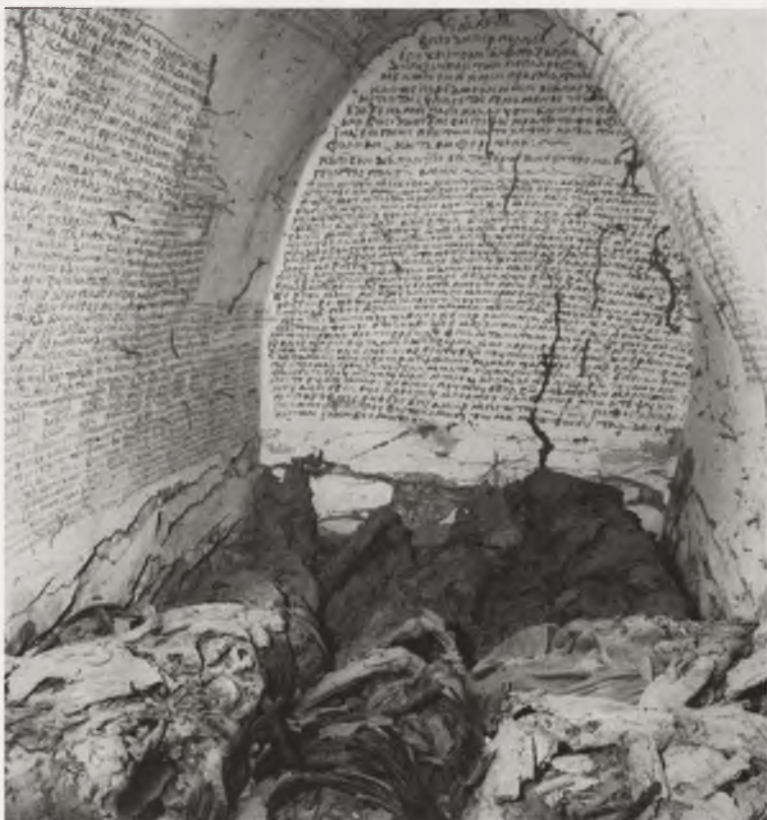
Ryc. 7. Wnętrze krypty grobowej bp. Georgiosa odkrytej pod kierunkiem S. Jakobielskiego w klasztorze św. Trójcy w Starej Dongoli w Sudanie

Abb. 6. Gemalter Kopf der hl. Anna aus dem 8. Jh. in der Wand der Domkirche in Faras geborgen, Nationalmuseum Warschau