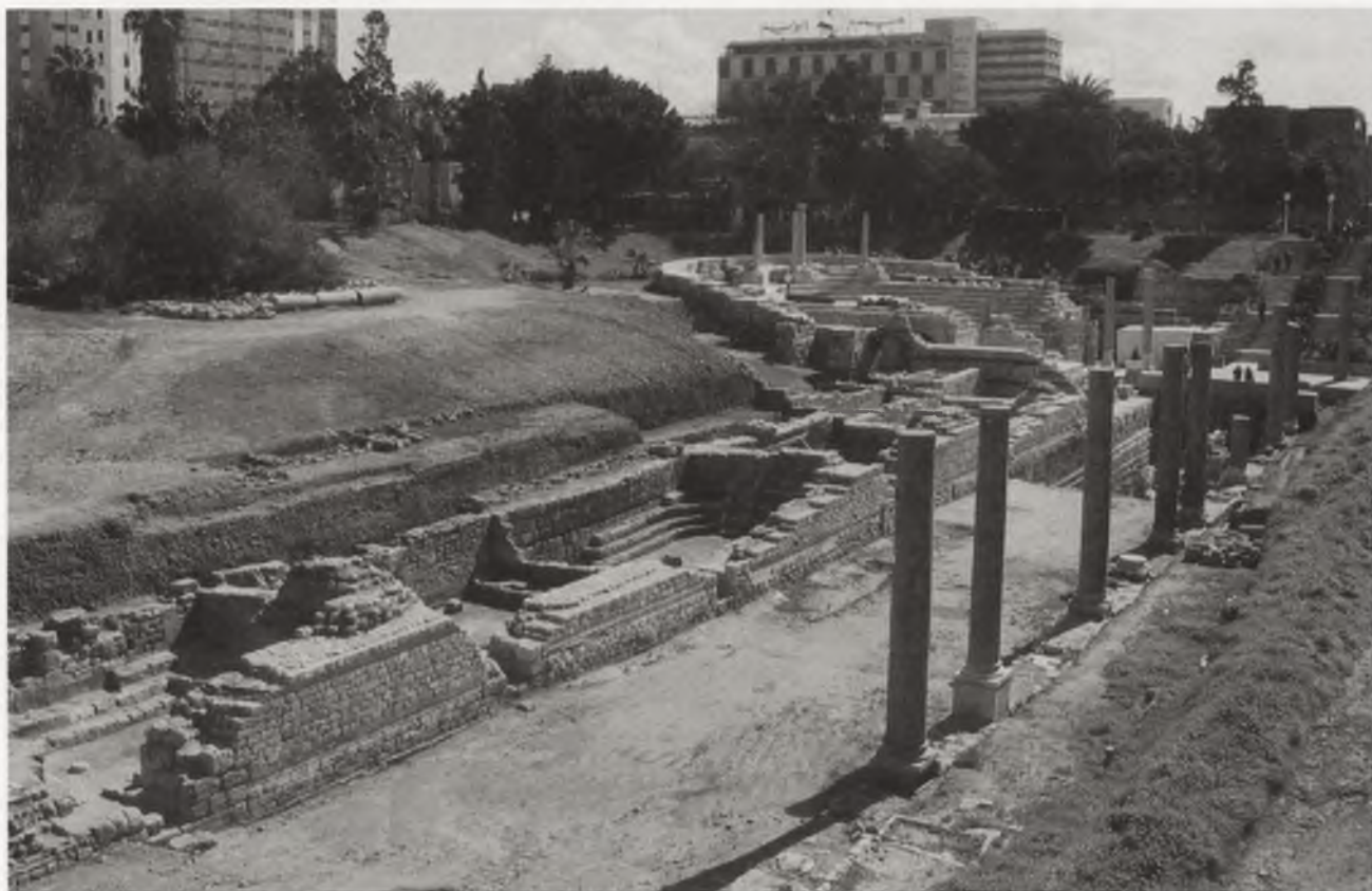
Ryc. 3. Późnoantyczne „audytoria” odkopane pod kierunkiem G. Majchereka na Kôm El-Dikka w Aleksandrii w Egipcie