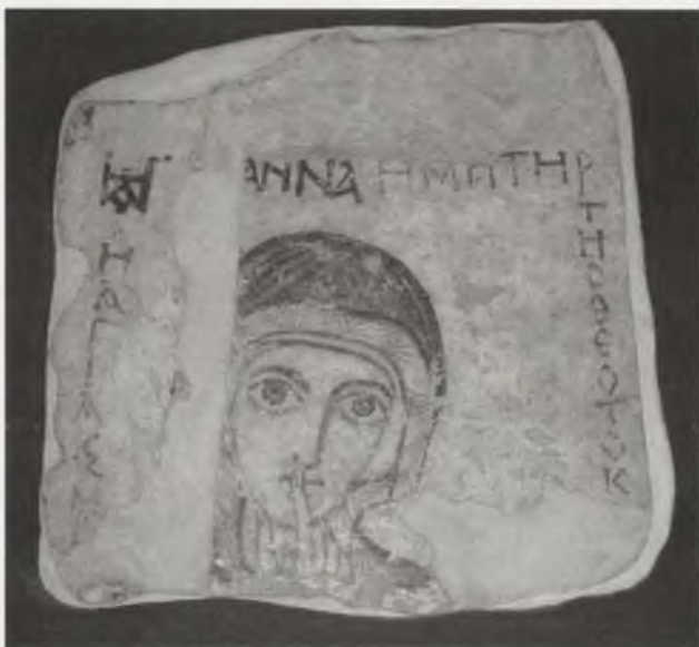
Ryc. 6. Malowana głowa św. Anny z VIII w. uratowana ze ściany katedry w Faras, Muzeum Narodowe w Warszawie

Abb. 6. Gemalter Kopf der hl. Anna aus dem 8. Jh. in der Wand der Domkirche in Faras geborgen, Nationalmuseum Warschau