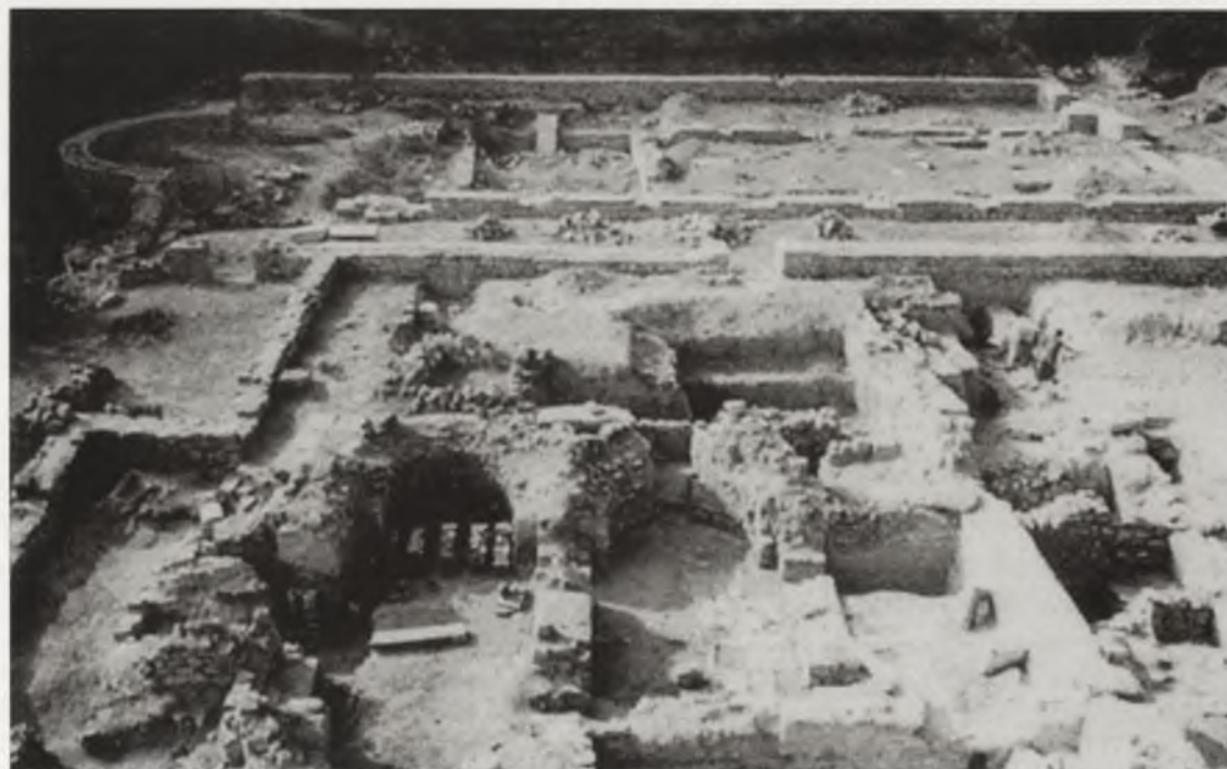
Ryc. 10. Pozostałości bazyliki chrześcijańskiej z V w. odkopanej przez Ekspedycję Archeologiczną UAM w Novae w Bułgarii Abb. 10. Überreste einer christlichen Basilika aus dem 5. Jh. durch die Archäologische Expedition der Adam-Mickiewicz-Universität Poznań in Novae in Bulgarien freigelegt