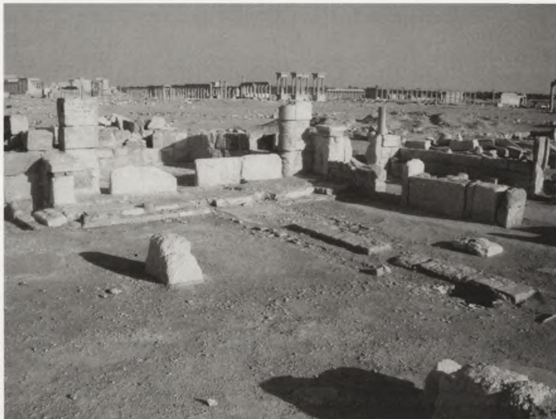
Ryc. 9. Pozostałości nawy centralnej bazyliki chrześcijańskiej z VI w. odkrytej pod kierunkiem Michała Gawlikowskiego w Palmyrze w Syrii Abb. 9. Überreste des Mittelschiffes der christlichen Basilika aus dem 6. Jh. von Michał Gawlikowski in Palmyra in Syrien entdeckt