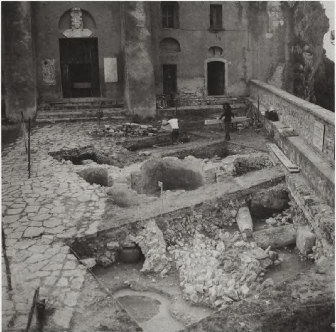
Ryc. 11. Wykopaliska włosko-polskie w 1977 r. przy kościele Madonny del Granato w Capaccio Vecchia we Włoszech