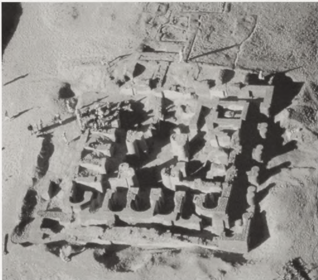
Ryc. 8. Widok z lotu ptaka kościoła Archanioła Rafała w Banganarti podczas wykopalisk kierowanych przez B. Żurawskiego w 1999 r.