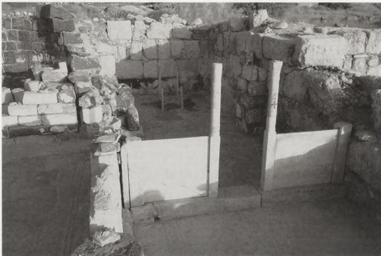
Ryc. 12. Pozostałości bazyliki chrześcijańskiej z V w. odkopanej pod kierunkiem J. Młynarczyk w Hippos-Susita w Izraelu