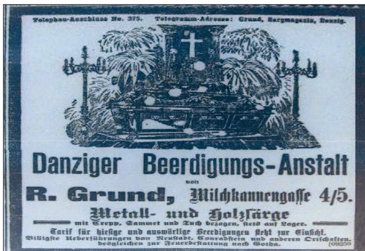
Ryc. 5. Reklama firmy oferującej akcesoria pogrzebowe