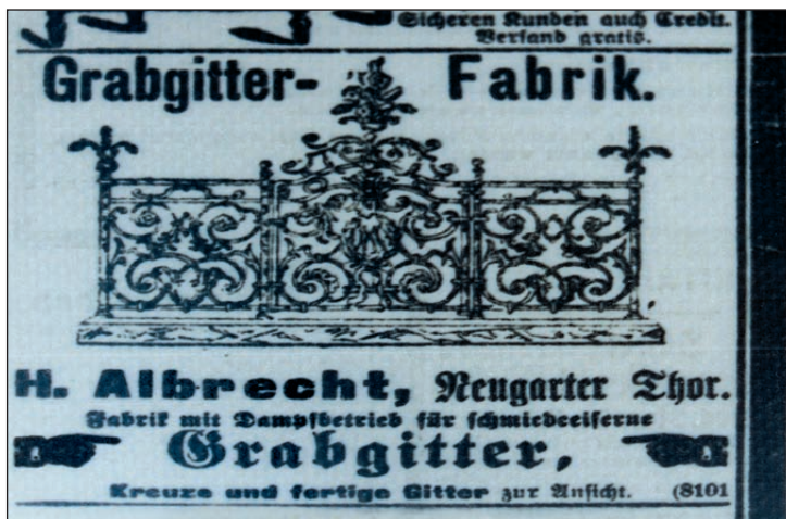
Ryc. 3. Krata nagrobna — w reklamie prasowej