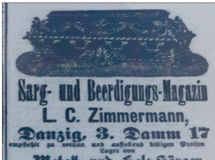
Ryc. 4. Reklama sklepu z trumnami i akcesoriami pogrzebowymi