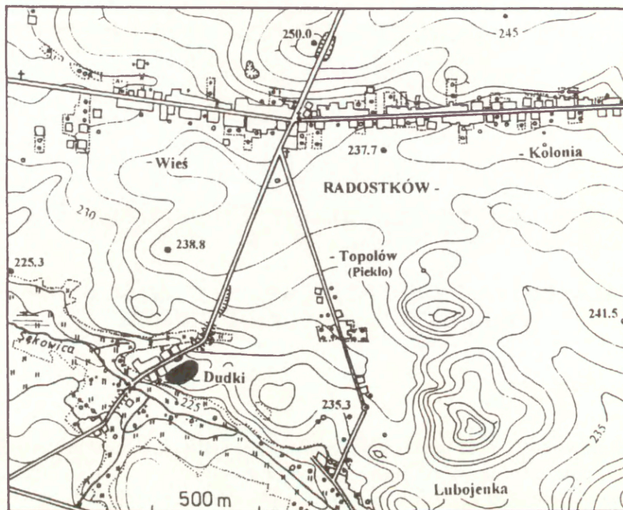
Ryc. 1. Położenie stanowiska 17 w Dudkach, pow. Częstochowa Fig. 1. Location of Site 17 in Dudki, Częstochowa district

dwóch poziomych linii rytych, podkreślonych u dołu pasmem skośnych nacięć. Pomiędzy uchami przebiega kolejna linia ryta, a poniżej niej pasmo poziomej, rytej jodełki. Brzusiec amforki jest natomiast zdobiony siedmioma pasmami pionowych, potrójnych linii rytych ograniczonych z obydwu stron skośnymi nacięciami. Ornament ten obejmuje górną część brzuśca, przekraczając nieco ku dołowi jego największą wydętą.