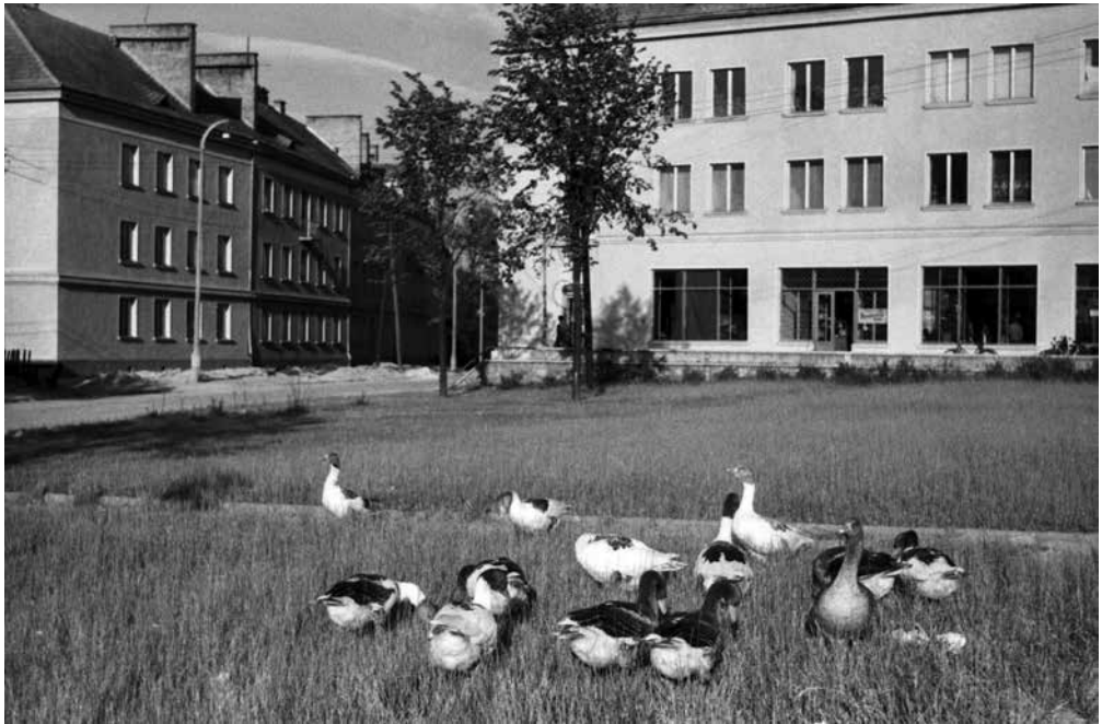
Fot. 6. Tychy, wypas gęsi na skwerze osiedla B, ok. 1957, fot. Zygmunt Kubski, Muzeum Miejskie w Tychach, sygn. MMTy/F/1831/2

O panowaniu książąt pszczyńskich autor powyższych słów wspominał już z mniejszym nacechowaniem ideologicznym. W „Budowniczym Nowych Tych” pojawiały się wówczas motywy tradycji ludowej – fotografie mężczyzn i kobiet, m.in. członkiń Ligi Kobiet i aktywistów ZMP, w strojach regionalnych, uczestniczących w oficjalnych imprezach masowych (Słania 1955).