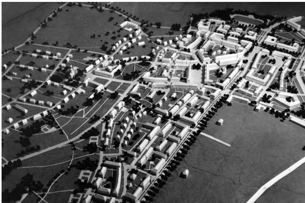
Fot. 2. Tychy, makieta przedstawiająca osiedle B (po prawej) płynnie łączące się z zabudową dawnej wsi (po lewej), ok. 1953, sygn. MMTy/F/41

założenia placu Centralnego. Zakładano zastąpienie starych wartości nowymi. Przybysze z całej ówczesnej Polski musieli poczuć się w nowym mieście na tyle swojsko, by chcieć w nim pozostać na całe życie. Zmienić się zatem miała struktura społeczna i ludnościowa miejsca. Odbywało się to poprzez działania najprostsze, a zarazem najbardziej agresywne np. burzenie chat na terenie Mogiły i Pleszowa, wytyczanie gruntu pod budowę na polach należących do dotychczasowych mieszkańców. Często odbywało się to przy protestach, co umiejętnie wykorzystywano w propagandzie – próby oporu były pokazywane jako symbol zacofania chłopów lub jako wynik działania wroga klasowego (Woroszyński 1955: 113). Sytuację komplikowała narracja o bliskości Krakowa. Podkreślano napięcie na linii stary i nowy porządek – robotnicza Nowa Huta i inteligencki Kraków.