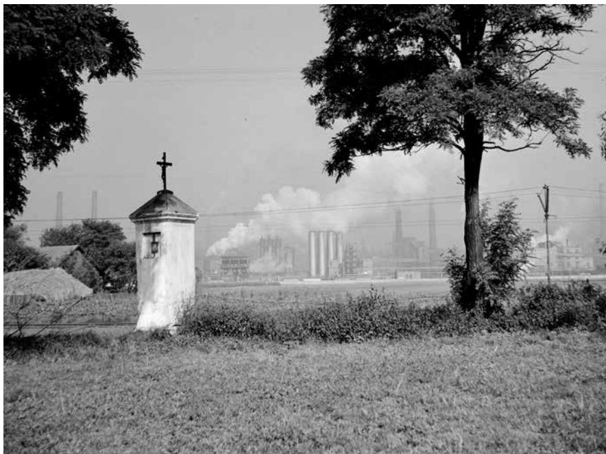
Fot. 4. Kapliczka z dawnej wsi Pleszów w Nowej Hucie przy ulicy Igołomskiej, w tle Huta im. Lenina, l. 60. XX w.