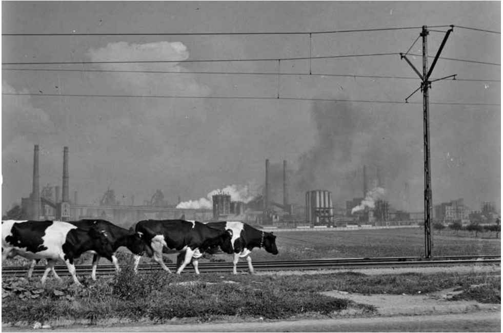
Fot. 3. Linia tramwajowa na polach przednowohuckich wsi, w tle Kombinat Metalurgiczny Huta im. Lenina (obecnie Arcelor Mittal Poland S.A.), I poł. I. 60. XX w. sygn. MHK-2697/N/2

z kopca. Przytaczano m.in. fragment z książki autorstwa Stefana Żeromskiego (Żeromski 1956: 244) 3 , mówiący o dawnych marzeniach o industrializacji Krakowa i emancypacji ludzi biednych dzięki rozwojowi przemysłu (Grochowska 2019: 124). Trzecim z nich było „antygermańskie” znaczenie legendy o Wandzie, co „nie chciała Niemca” i państwoiańska wymowa tego mitu. To narracja żywa w czasach Polski Ludowej, kiedy była jedną z reakcji na traumę II wojny światowej, wygodną dla władzy.