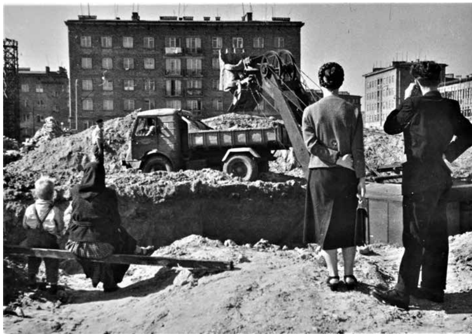
Fot. 1. Nowa Huta koło Krakowa w budowie, ok. 1955 r., fot. Wiesław Tomaszkiwicz, Muzeum Fotografii w Krakowie - MuFo, sygn. MHF 21405/II

nieprzystąpienie Polski do planu Marshalla w 1948 roku i ostateczne dostanie się w strefę wpływów sowieckich. Dodatkowo lokalizację tę komplikował fakt nieusankcjonowanej prawnie granicy z Niemcami.