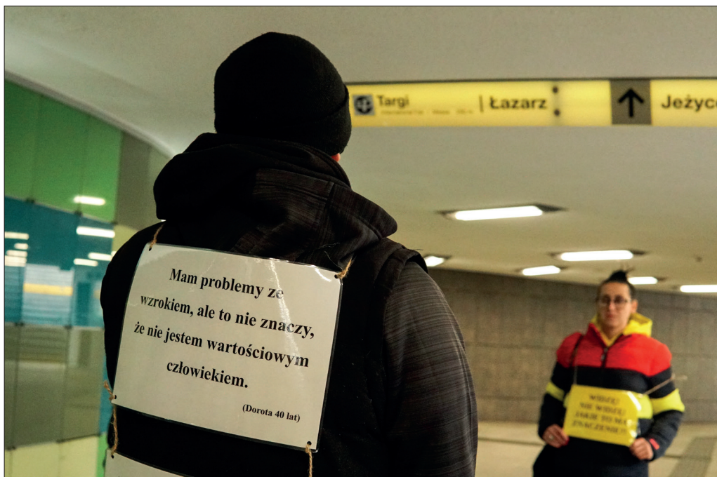
Fot. 3 Poznań, rondo Kaponiera, fot. S. Kowańska.

aby ukazywało zorientowanie etnografii na przyszłość. Autorzy projektu, wczuwając się w potrzeby odbiorców oraz starając się zrozumieć specyfikę języka migowego, uzyskali nie tylko znak w PJM określający „muzeum etnograficzne”, ale również zbudowali zaangażowanie odbiorców i promowali wydarzenia dostępne w muzeum, opowiedzieli też, czym jest dyscyplina nazywana etnografią.