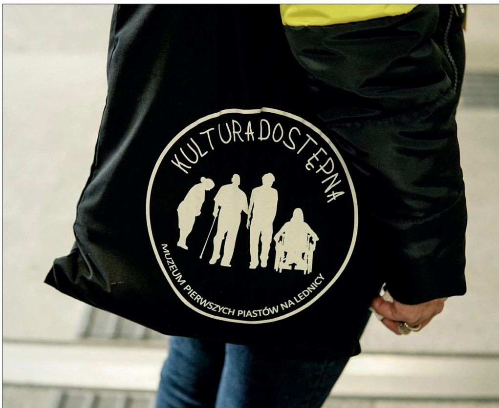
Fot. 1 Poznań, rondo Kaponiera, fot. S. Kowańska.

Wiele instytucji kultury zмага się z problemem frekwencji podczas organizowanych przez nich wydarzeń ukierunkowanych na środowiska osób z niepełnosprawnościami. Z podobnym kłopotem mierzyło się Muzeum Etnograficzne im. Seweryna Udzieli w Krakowie. Mimo że muzeum to od lat stara się wykonywać działania