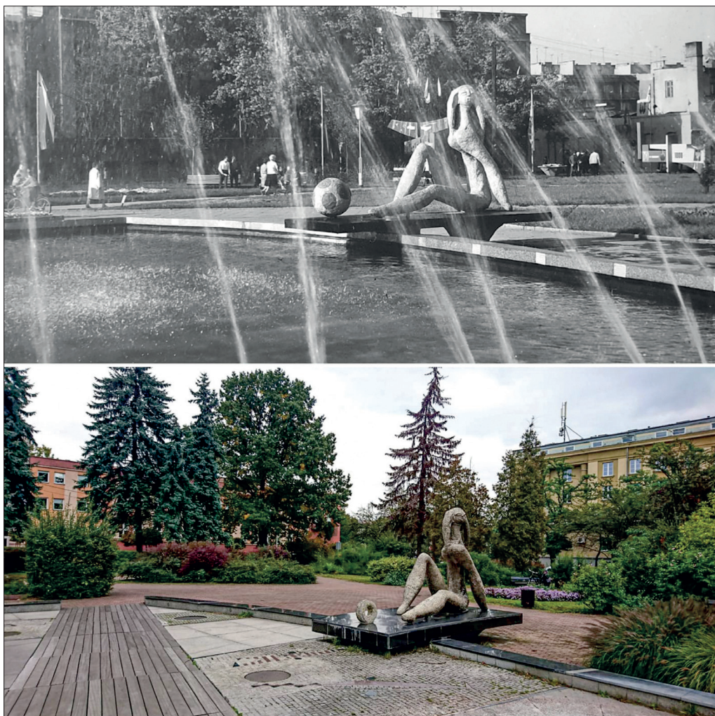
Il.3. Fontanna „Pani Kowalska” projektu Włodzimierza Ściegiennego w 1964 r. i w 2019 r. (zdj. archiwum Włodzimierza Ściegiennego, zdj. E. Malec-Zięba).