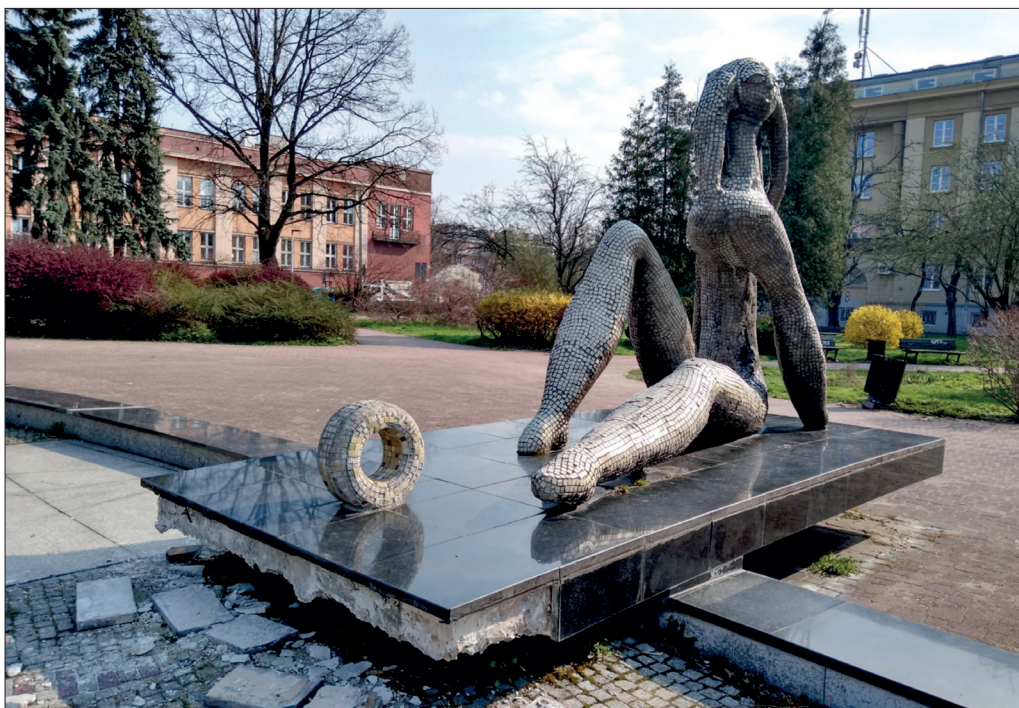
Il.5. Zniszczona fontanna „Pani Kowalska” w 2021

I niech się rozsypie ta ohydna rzeźba i niech już nie straszy. A może po prostu czas aby zmienić to szkaradztwo. Wiem, że dla wielu ten pomnik to dużo wspomnień ale czas idzie do przodu i można by było postawić coś ładniejszego trzeba zrobić referendum Częstochowian 23 .