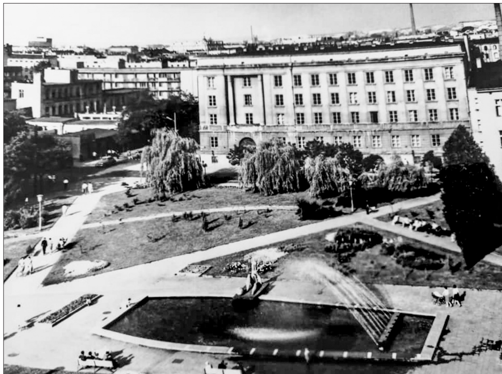
Il.1. Fotografia pokazująca skwer ze zrealizowaną fontanną autorstwa Włodzimierza Ściegiennego z 1964 roku.

dno fontanny (pomagała mu w tym, jak zawsze, żona – Karolina Ściegienny). Szablony z ułożoną mozaiką służyły następnie do przełożenia i zatopienia wzoru w ostatecznym podłożu.