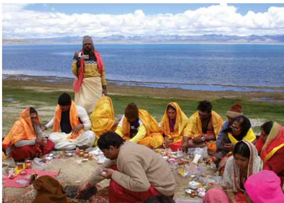
Grupa uczestników Indyjskiej Pielgrzymki Narodowej do świętej góry Kailaś, Tybet, 2007 r.

Ośrodek Etnologii i Antropologii Współczesności w zależności od realizowanych zadań, także tych wynikających z krajowych i zagranicznych projektów badawczych, oraz ich problematyki współpracuje z wieloma polskimi oraz zagranicznymi instytucjami badawczymi (uczelnianymi i muzealnymi) na obu półkulach, a jego pracownicy są członkami licznych międzynarodowych organizacji, komisji i stowarzyszeń naukowych.