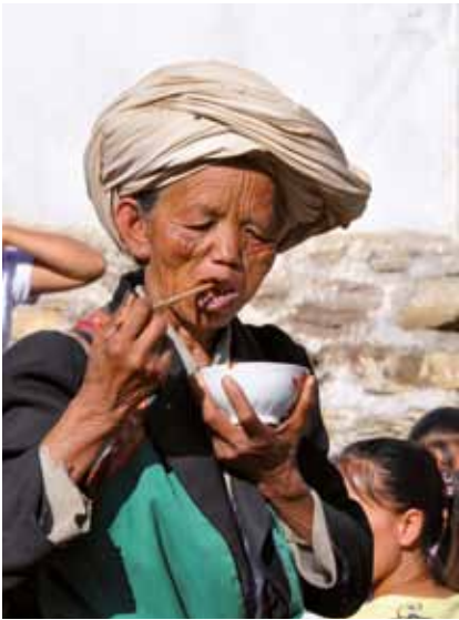
Kobieta narodowości Bai, Chiny Bai woman, China.