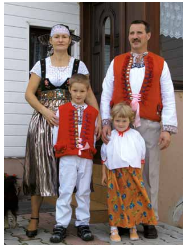
Współczesna wieś polska, rodzina z Koniakowa Contemporary Polish village, family from Koniaków