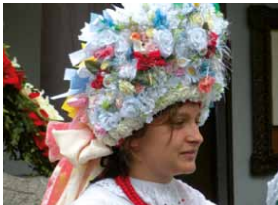
Bamberka w odświętnym stroju, Polska, 2010 r. A Bamber woman in holiday dress, Poland, 2010

Depending on current research projects and tasks, both national and international, the Centre of Ethnology and Anthropology of the Contemporary cooperates with Polish and foreign research institutions around the world, both museums and academic centres. The Centre's employees are members of numerous international scientific organizations, committees and associations.