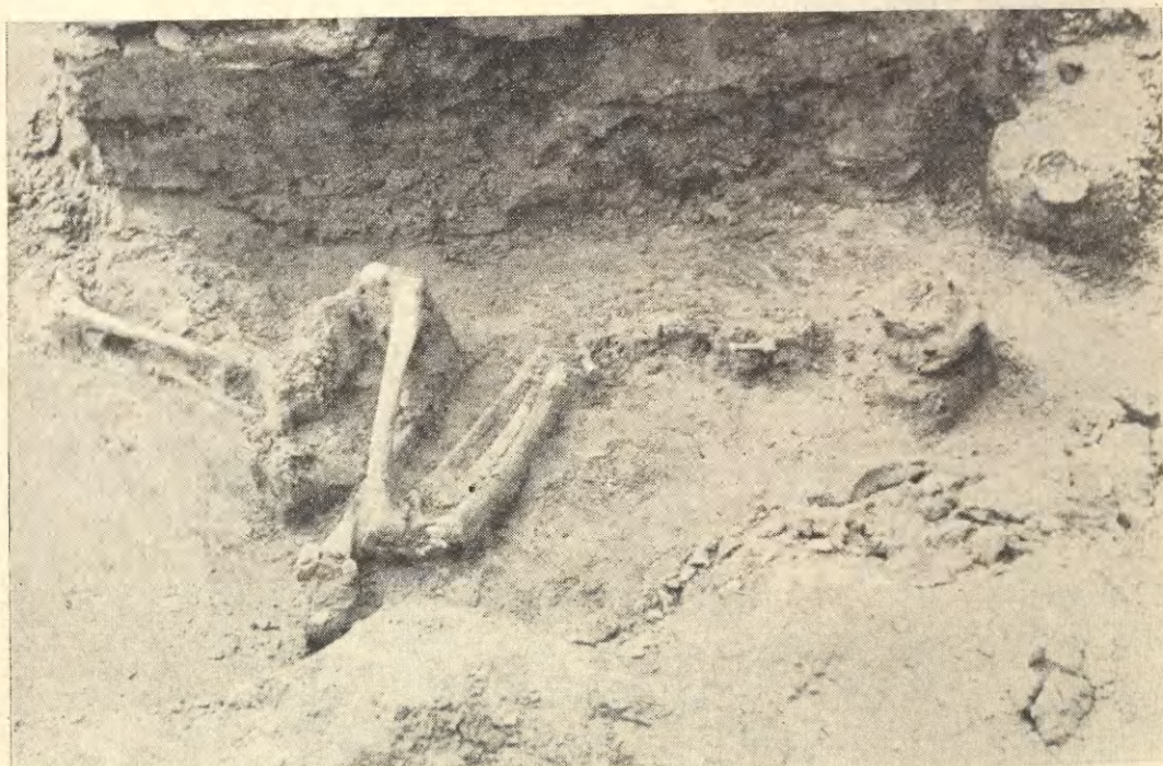
Ryc. 2. Przemyśl, ul. Pstrowskiego. Widok odkrytego grobu od strony wschodniej View of the grave from the east side

Naczynie amforkowate o profilu esowatym, zaokrąglonym dnie, z nieznacznie wychyloną krawędzią. Szyjka zdobiona ornamentem w postaci pionowych linii rytych z poprzecznymi kreskami — motywem zbliżonym do jodełki. Ceramika