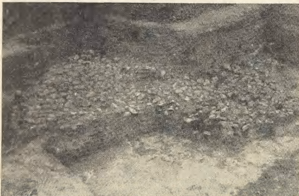
Ryc. 2. Witów, pow. Kazimierza Wielka. Bruk kamienny nad jamą nr 6. Pod brukiem (w lewej części zdjęcia) widoczny zarys jamy

kultury ceramiki sznurowej na osi N—S, głową na południe. Zwłoki leżały w pozycji skurzonej, na prawym boku, twarzą zwrócone ku wschodowi. W jamie grobowej przy szkielecie znajdowały się następujące zabytki: puchar o profilu esowatym z dobrze wyodrębnionym dnem, o silnie wydętym brzuścu, zdobiony na szyjce i górnej części brzuśca poziomymi odciskami sznura. Pod strefą ornamentu sznurowego na górnej części brzuśca znajduje się rząd pionowych nakłuć, ograniczający od dołu ornamentowaną część naczynia. Pucharek ten należy zaliczyć do typu IIa 5 . W grobie znajdował się również toporek kamienny typu IV i siekierka ze ścienio-