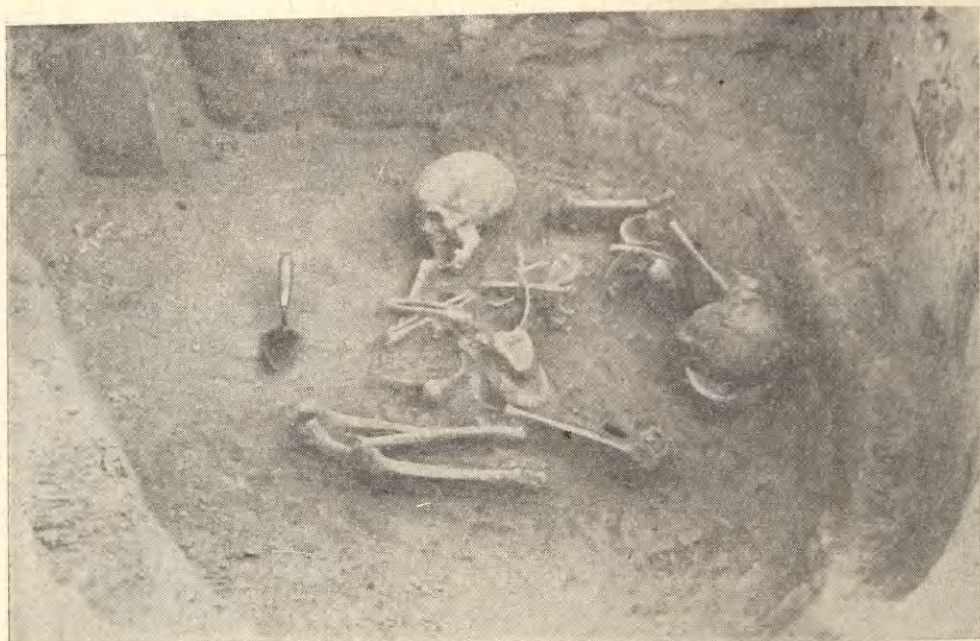
Ryc. 3. Witów, pow. Kazimierza Wielka. Pochówek z jamy nr 6. Szpachelka wskazuje kierunek północny

Burial from pit no. 6. The trowel points to North