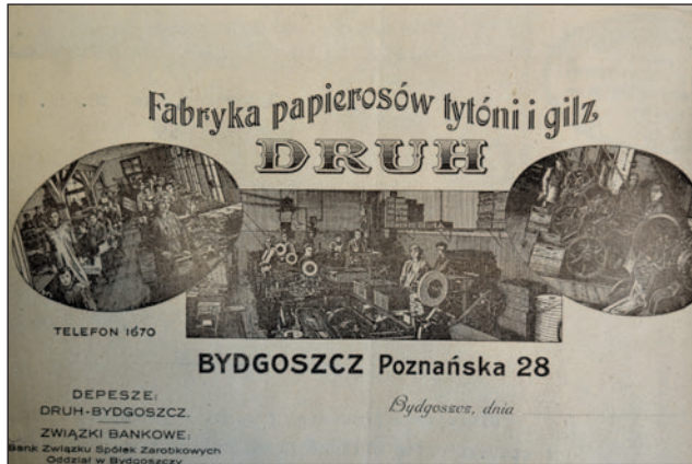
Ryc. 7. Winieta papieru firmowego Fabryki Papierosów, Tytoni i Gilz „Druh”

Fig. 7. Vignette of the letterhead of the “Druh” Factory of Cigarettes, Tobacco, and Rolling paper ( Fabryka Papierosów, Tytoni i Gilz “Druh” )