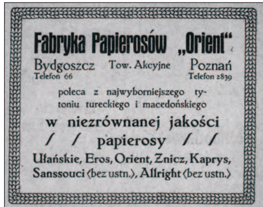
Ryc. 9. Reklama Fabryki Papierosów „Orient” (źródło: Łabędziński S. 1920, s. 8)

15 września 1919 r. kupcy Szmytkiewicz, Karasiński i Misterek zawiązali Spółkę Akcyjną „Orient” Towarzystwo Akcyjne w Poznaniu, z siedzibą w Bydgoszczy. Na potrzeby fabryki kupiono dawne kasyno oficerskie. Firma była notowana na Giełdzie Poznańskiej i zatrudniała ponad 100 pracowników. Najlepiej sprzedającym się produktem były papierosy „Palome” produkowane z mieszanki różnych tytoni 52 . W 1921 r. produkowano