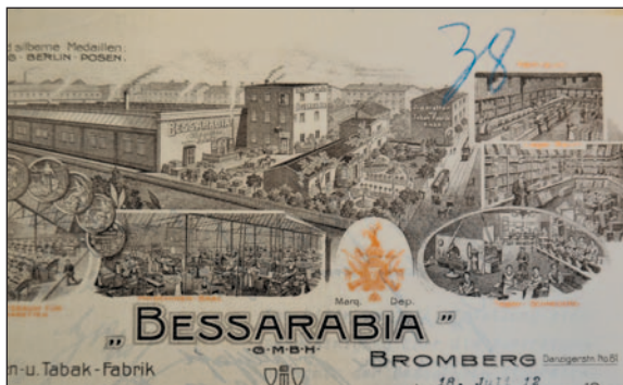
Ryc. 5. Winieta papieru firmowego Fabryki Papierosów i Tabaki „Bessarabia”

M. Sentkowski, Złotowski, Kielczyński, L. Krzywiński. Od 1909 r. zakład produkował tylko papierosy, zarzucając produkcję tytoniu i zmieniając pierwotną nazwę na „Fabryka Rosyjskich Papierosów «Bessarabia»” 38 . Do ich wyrobu sprowadzano tytoń z Turcji i Rosji, z którego wytwarzano papierosy „Mon Plaisir”, „Goldelschen”, „Aplex”, „Noblesse” i „Alupka” 39 . Wła-