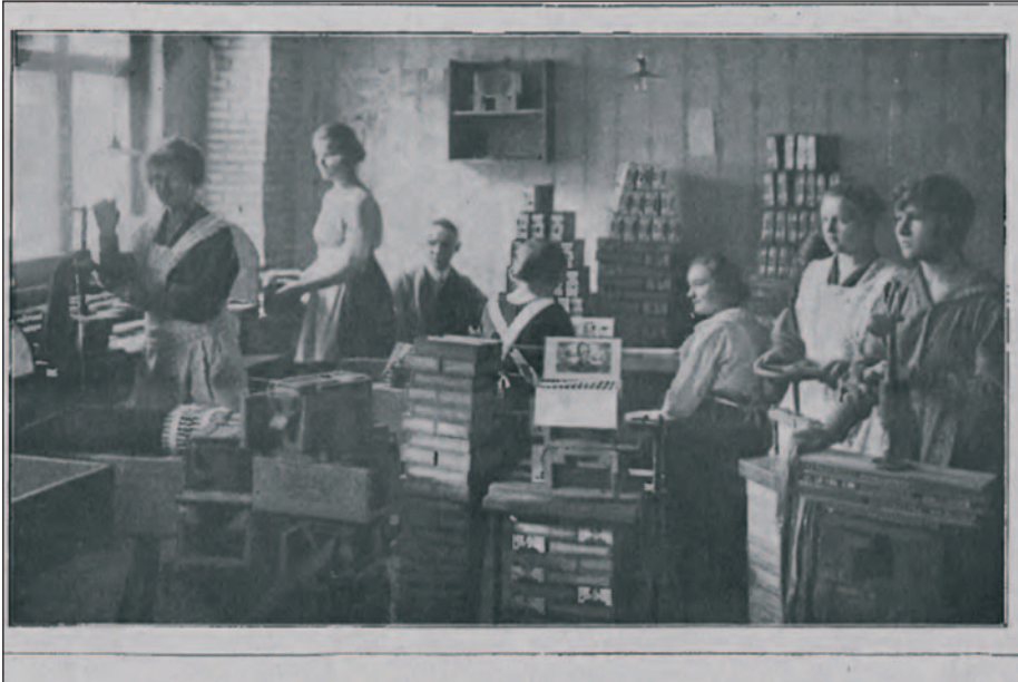
Ryc. 8. Oddział robotnic w fabryce tytoniu K. Blocha

Fig. 8. A team of female workers in K. Bloch's tobacco factory