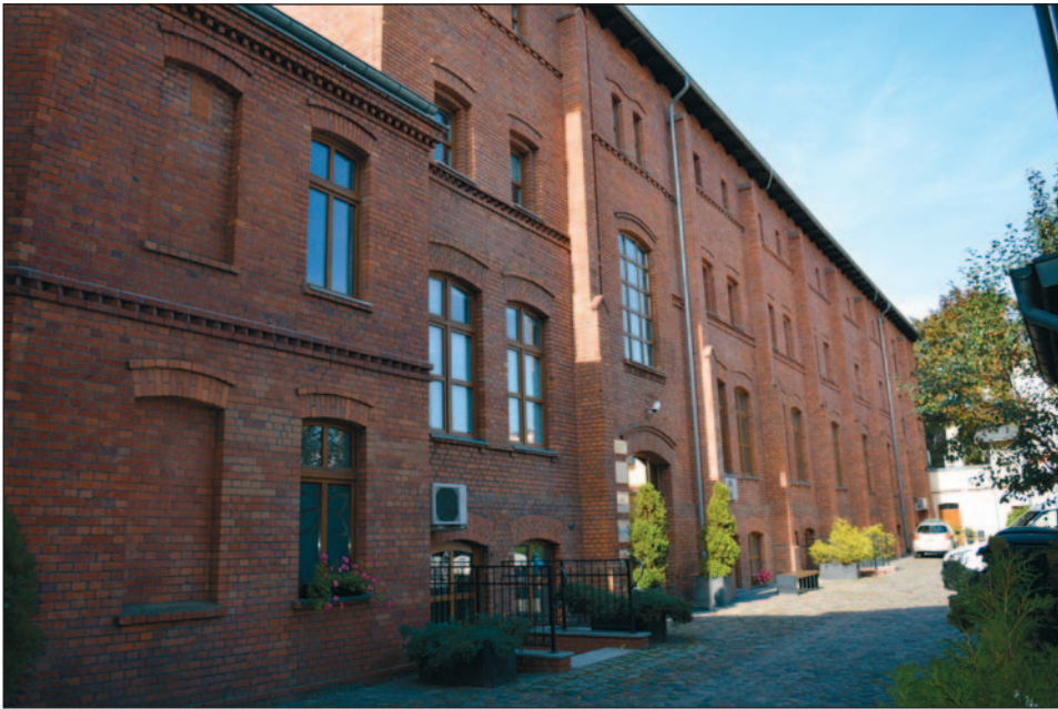
Ryc. 3. Zabudowa pofabryczna dawnej Fabryki Tabaki Dawida Woythaler na parceli przy obecnej ul. Focha 18

teren fabryki obecnie: zachowana zabudowa pofabryczna (funkcja mieszkalno-usługowo-biurowa) (ryc. 3).