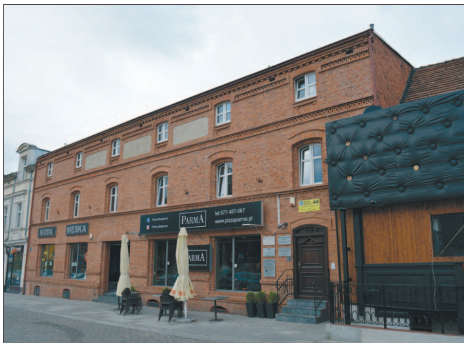
Ryc. 10. Zabudowa pofabryczna dawnej Polskiej Fabryki Tytoniu Juliana Króla przy obecnej ul. Długiej 63

teren fabryki obecnie: zachowana zabudowa pofabryczna (funkcja mieszkalno-usługowo-biurowa).