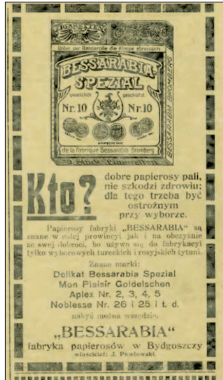
Ryc. 6. Reklama Fabryki Papierosów i Tabaki „Bessarabia”

W 1909 r. powstała Fabryka Tabaki pod nazwą Franz Lehmann. Tabakfabrik. Właściciel firmy został powołany w 1918 r. do armii niemieckiej i wysłany na front wschodni, gdzie „przeszedł całą Ukrainę i Macedonię, zwiedził Odessę, Chersoń, Mikołajów, oglądał po drodze słynne plantacje rosyjskiego i macedońskiego tytoniu” 46 . Po powrocie do Bydgoszczy w 1920 r. F. Lehmann przekształcił swój zakład w Fabrykę Papierosów, Tytoniu i Gilz „Druh”. Rozbudował go w 1921 r. i tym samym jego firma zajmowała na parceli siedem budynków i szopę, gdzie składowano tytoń 47 .