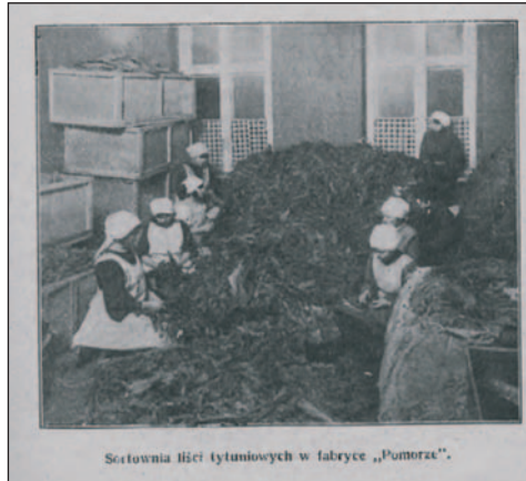
Ryc. 12. Sortownia liści tytoniowych w fabryce „Pomorze”

Założona w 1921 r. fabryka swoją pierwszą siedzibę miała przy ul. Cieszkowskiego, w tym samym roku przeniesiona została do