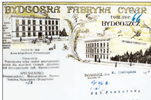
Ryc. 4. Winieta papieru firmowego Bydgoskiej Fabryki Cygar