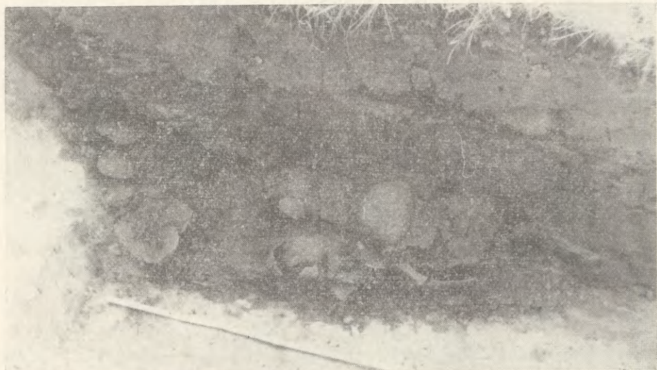
Ryc. 2. Wieliczka, pow. Kraków, stan. X. Profil paleniska z osady wczesnocśrednio-wiecznej

Pierwsza z nich, oznaczona jako stanowisko nr IX, położona jest we wschodniej części miasta, obok cmentarza parafialnego, na zboczu kotlinowatego obniżenia, ciągnącego się w kierunku Śledziejowic i Czarnochowic. W jednym z trzech założonych tutaj wykopów natrafiono, na głębokości 110—160 cm, na warstwę czarnej,