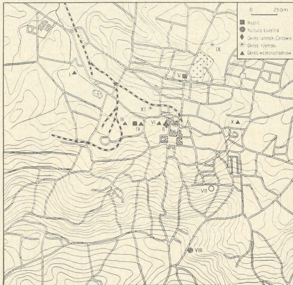
Ryc. 4. Wieliczka, pow. Kraków. Rozmieszczenie stanowisk archeologicznych wg stanu badań z 1964 r.:

Jama druga posiadała kształt prostokątny, o wymiarach 120 × 80 cm i wypełniona była czarną ziemią z dużą ilością polepy.