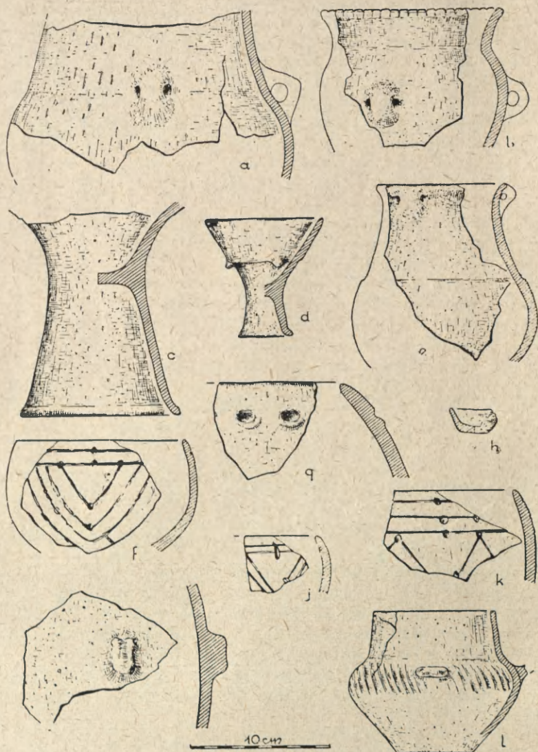
Ryc. 2. Złotniki, pow. Proszowice:

a — ceramika typu bodrogkerezsturskiego; — k — ceramika wstęgowa ryta; — naczynie kultury ceramiki promienistej z grobu głowy bydłacej