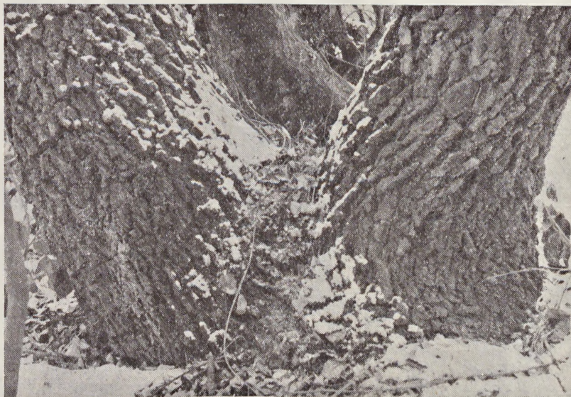
Ryc. 2. Charakterystycznie spękana korowina dolnych części pnia brzozy czarnej Betula obscura u osobnika rosnącego na zboczach Złotej Góry. — The characteristically split cork of the lower parts of the trunk of a specimen of the black birch, Betula obscura , growing on the slope of the Golden Mountain.

Najwięcej skupień B. obscura (56% notowań) znajduje się w powstałych spontanicznie drzewostanach z dominującą brzozą brodawkowatą i niewielkim zwykle udziałem sadzonego modrzewia europejskiego, świerka pospolitego lub sosny zwyczajnej, na siedliskach lasów