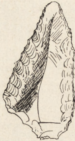
Ryc. 3. Krzewica, pow. tomaszowski, woj. lubelskie. Skrobacz krzemienisty, w. n.

Trzy krzemienne grociki sercowate retuszowane obustronnie na całych powierzchniach (ryc. 4). Długość 2,5, 2,0 i 1,8 cm.