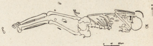
Ryc. 1. Krzewica, pow. tomaszowski, woj. lubelskie. Plan grobu kultury ceramiki sznurowej

wschód-zachód. Dno grobu wystąpiło na głębokości 85 cm. W jamie natrafiono na szkielet mężczyzny z głową w kierunku wschodnim (ryc. 1). Czaszka ułożona na prawej kości skro-