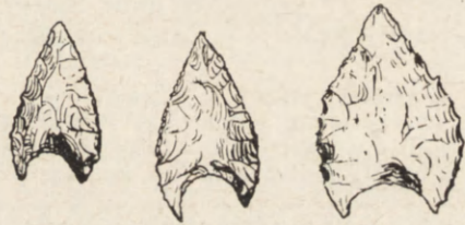
Ryc. 4. Krzewica, pow. tomaszowski, woj. lubelskie. Grociki krzemienne, w. n.