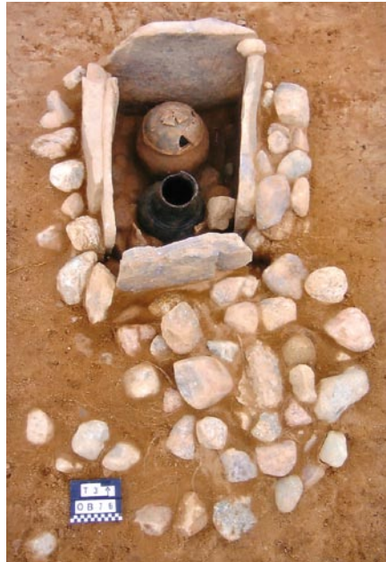
Ryc. 3. Trzebiatkowa, pow. Bytów, stan. 3. Grób skrzynkowy (obiekt 76/05). Widok od strony południowej.