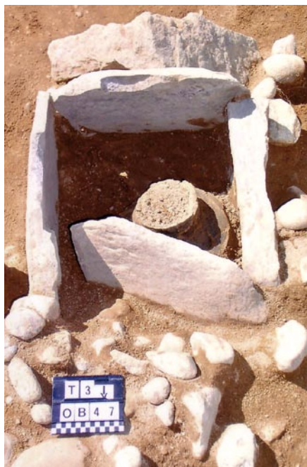
Fig. 1. Trzebiatkowa, dist. Bytów, site 3. Cist grave (feature 47/04). A view from the north. Ryc. 1. Trzebiatówka, pow. Bytów, stan. 3. Grób skrzynkowy (obiekt 47/04). Widok od strony północnej.