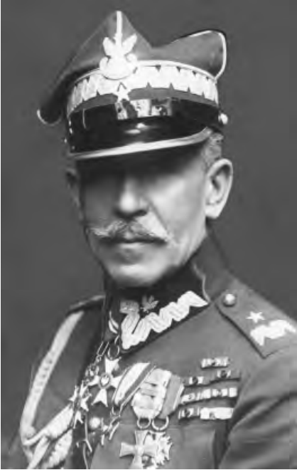
7. Gen. bryg. Mariusz Zaruski, starosta morski w Pucku (1927).