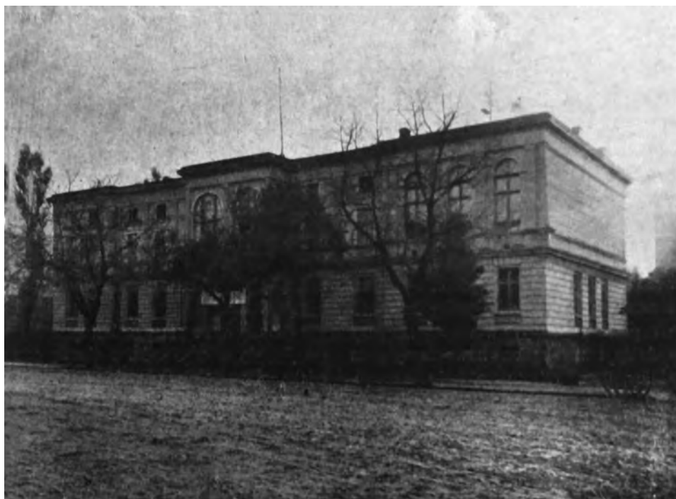
13. Gmach Starostwa Powiatowego w Brodnicy.