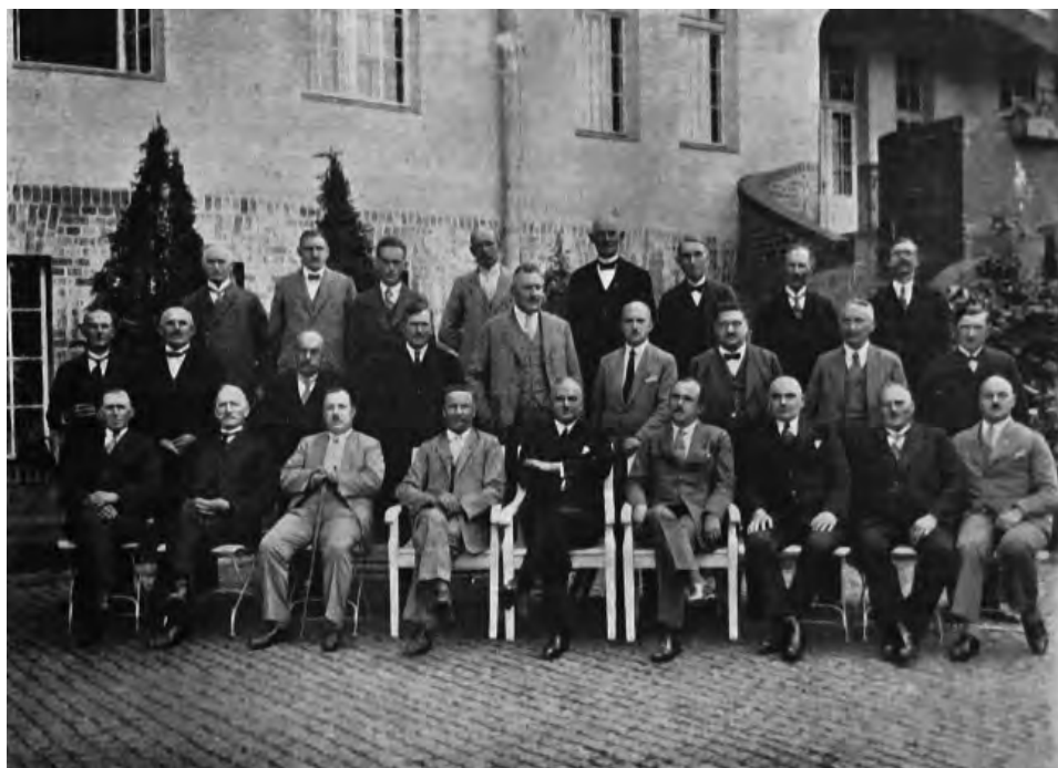
16. Sejmik Powiatowy w Chełmnie, 1930 r.