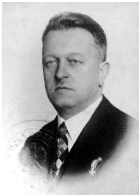
33. Bazyli Rogowski, starosta powiatowy i grodzki toruński (1932–1934).