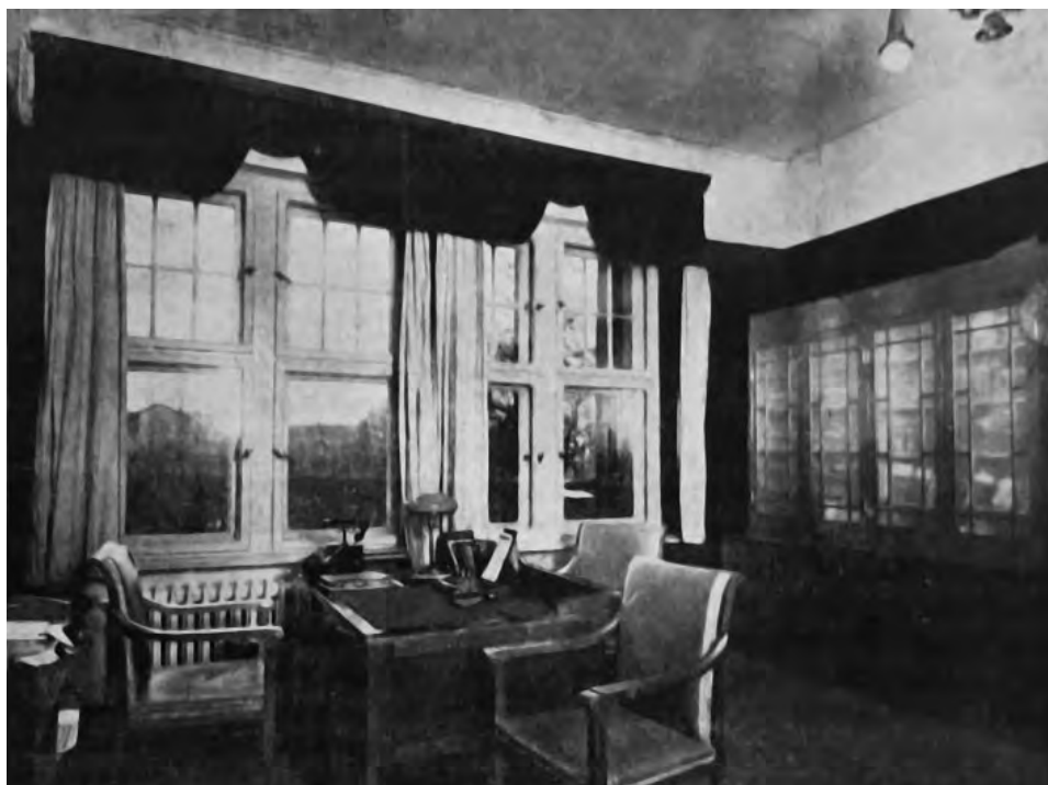
11. Gabinet starosty tczewskiego, 1930 r.