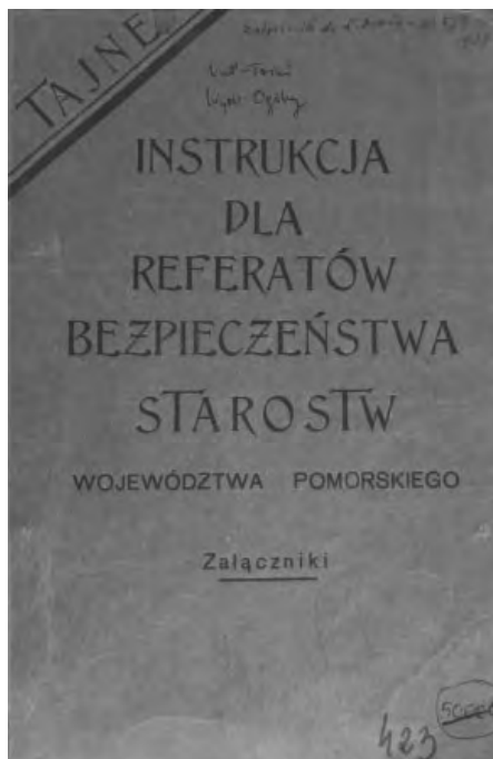
34. Instrukcja dla referatów bezpieczeństwa starostw województwa pomorskiego, 1935 r.