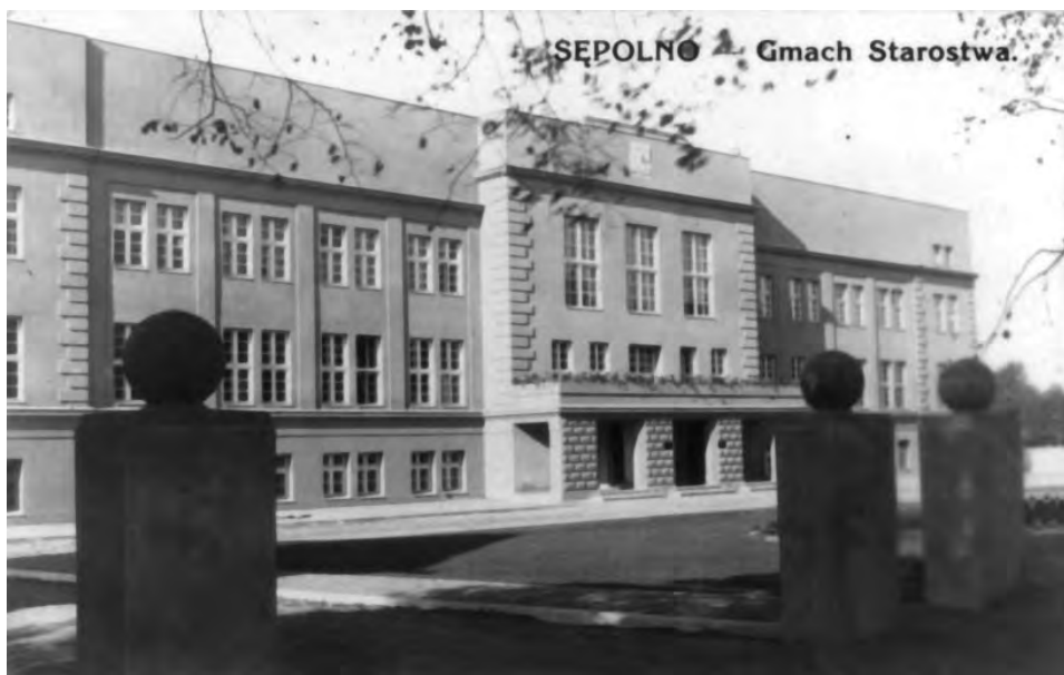
20. Gmach Starostwa Powiatowego w Sępólnie.