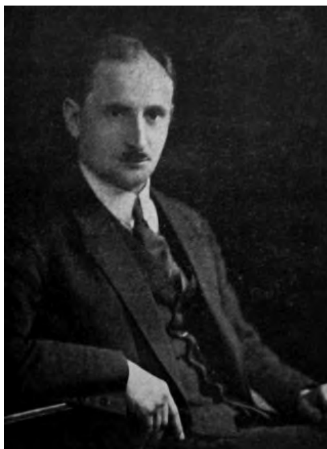
28. Jan Plackowski, starosta działdowski (1927–1931).