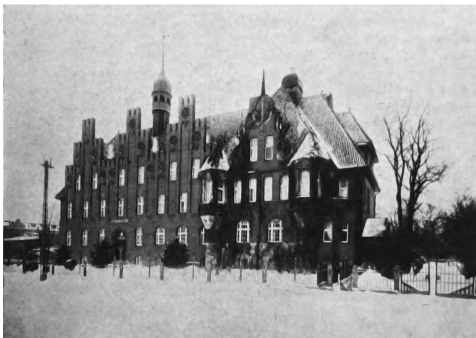
12. Gmach Starostwa Powiatowego w Tczewie.