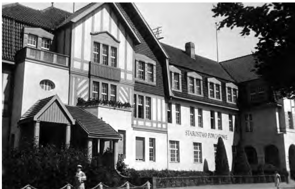
15. Gmach Starostwa Powiatowego w Chełmnie.