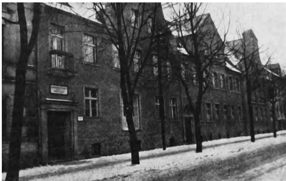
19. Gmach własny powiatu dziadowskiego, mieszczący biura starostwa, wydziału powiatowego i powiatową KKO.