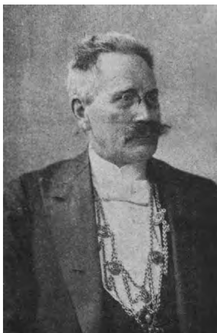
3. Stanisław Sikorski, pierwszy starosta chojnicki (1920–1923).