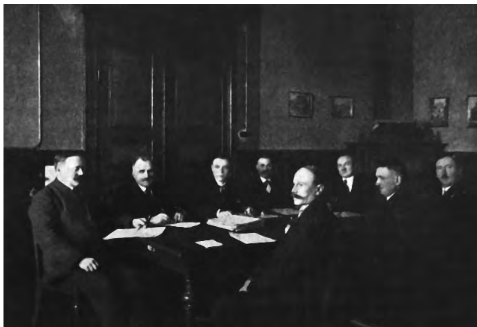
18. Posiedzenie Wydziału Powiatowego w Kościerzynie, 1930 r.