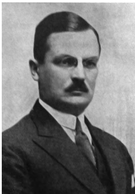
31. Seweryn Czerwiński, komisarz rządu w Gdyni (1932–1933).