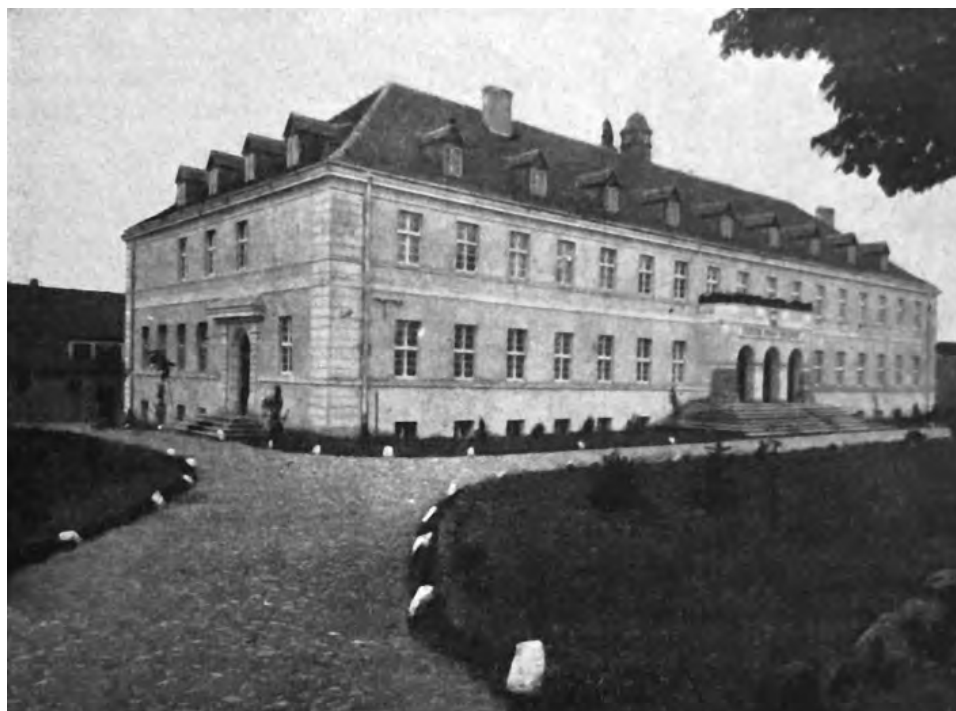
17. Gmach Starostwa i Wydziału Powiatowego w Gniewie.