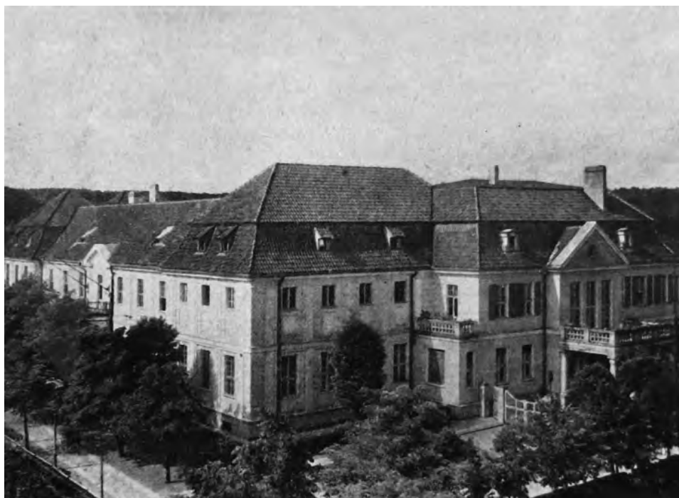
21. Gmach Starostwa Morskiego w Wejherowie.