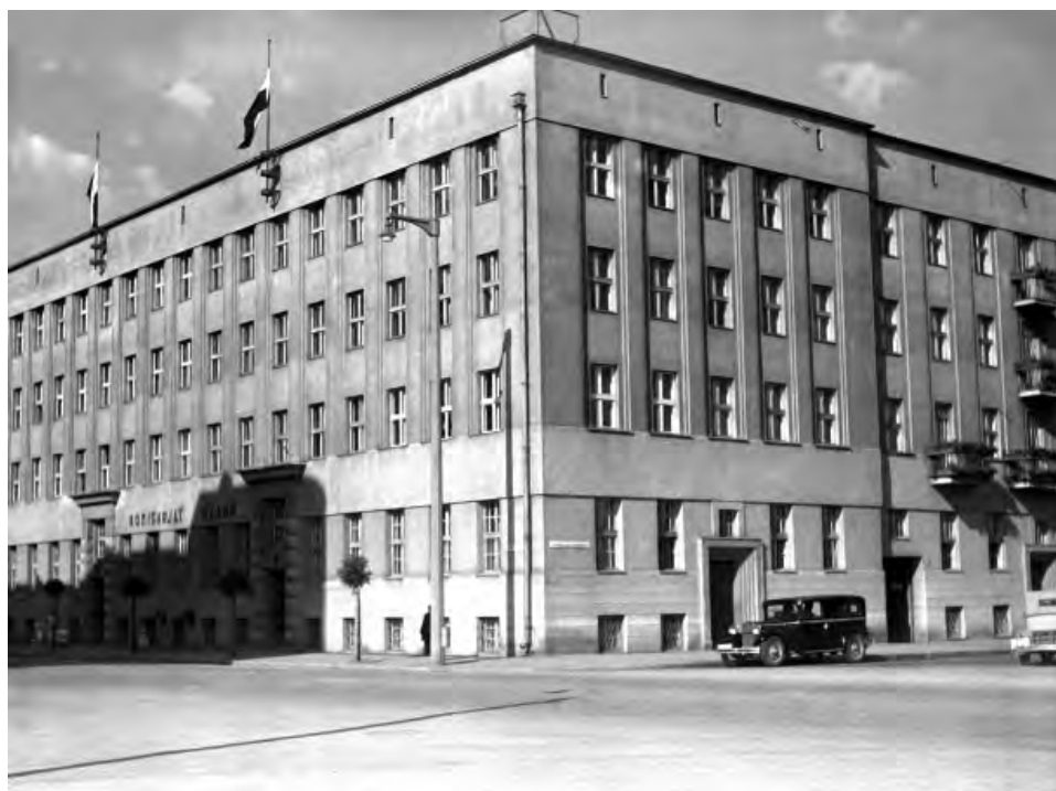
22. Gmach Komisariatu Rządu w Gdyni.