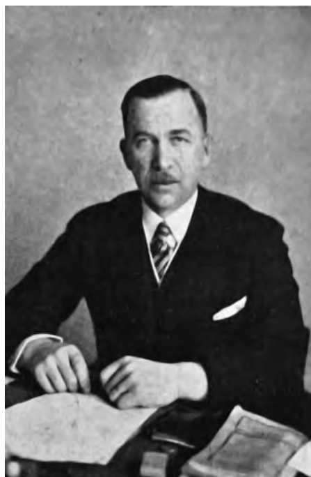
30. Mieczysław Pożerski, starosta grodzki w Gdyni (1929–1931).