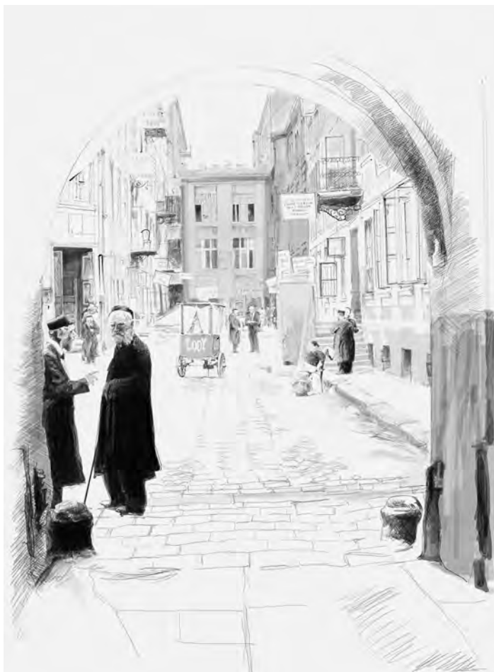
3. Podwórko łódzkiej kamienicy. Rysunek własny na podstawie zdjęcia Włodzimierza Pfeiffera; Archiwum Państwowe w Łodzi.

wydzieleniu tych specjalnych stref przyjmowały formę bądź już funkcjonujących w danym miejscu krawędzi, bądź też stosowano specjalne łańcuchy lub sznury definiujące materialnie zasięg oddzielenia.