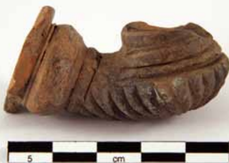
Główka lulki z zamku w Tykocinie, XVII-XVIII w. Pipe head from the castle in Tykocin, 17th-18th century

The publications of the Centre bring out a picture of the real life of the inhabitants of ancient Poland and its neighbouring countries. The reconstruction of this picture is made possible by the study of all kinds of sources: written documents, iconography, cartographic sources, material evidence of the past excavated by archaeologists, as well as items preserved in museum collections and in the field.