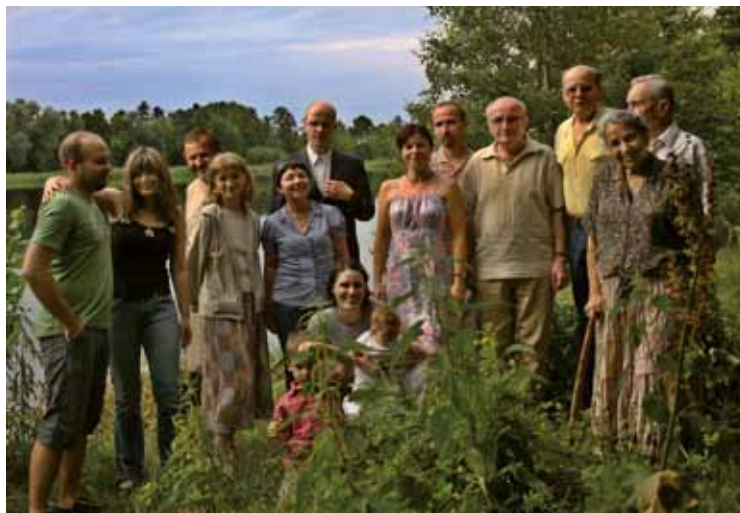
Pracownicy ZHKM w 2009 r. Staff of the Centre in 2009

Publikowane prace odśladają obraz realnej egzystencji mieszkańców dawnej Polski i krajów ościennych. Jego odtwarzanie jest możliwe dzięki wykorzystaniu źródeł pisanych, ikonografii, materiałów kartograficznych, materialnych relikwów przeszłości wydobywanych przez archeologów, a także zabytków zachowanych w muzeach i przetrwałych w terenie.