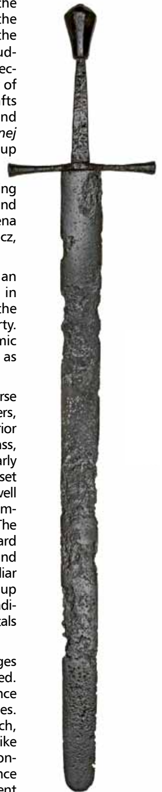
Miecz katowski odkryty w podziemiach kościoła św. Katarzyny w Warszawie

The Centre conducts archaeological excavations of features from the late Middle Ages almost through modernity (e.g. church of St. Catherine in Warsaw, castles in Puck and Tykocin), and not the least, the reconstruction of ancient furnaces.