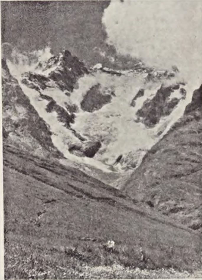
Ryc. 115. Formy skalne i lodowce w rezerwacie masywn Pelvaux we Francji