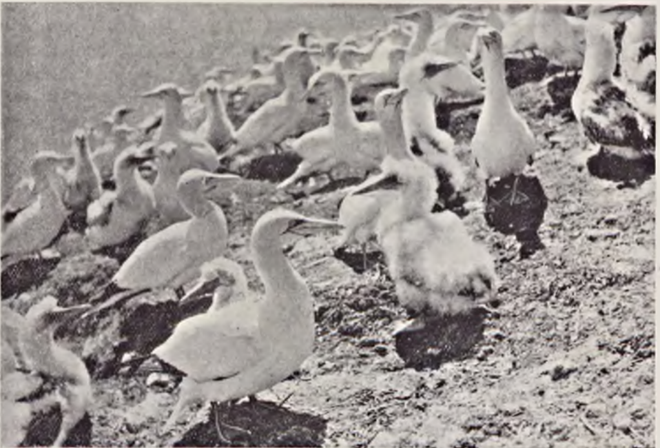
Ryc. 117. Kolonia głu ptaków Sula bassana w rezerwacie na Wyspie Bonawentury (Kanada)