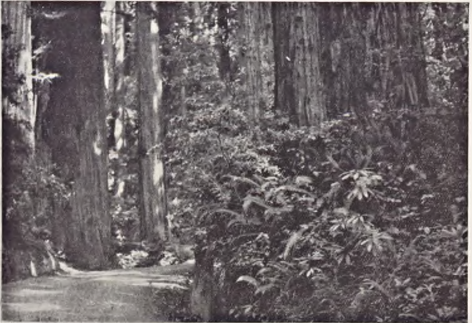
Ryc. 116. Las sekwoi wieczn zielonej Sequoia sempervirens w rezerwacie koło Crescent City w północnej Kalifornii