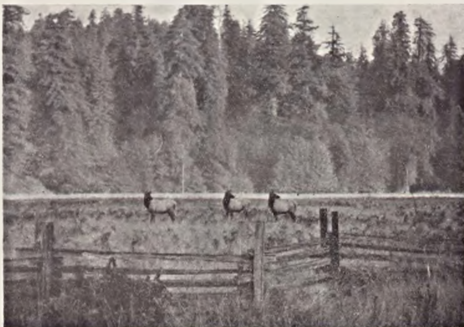
Ryc. 118. Rezerwat jeleni wapiti Cervus canadensis koło Prairie w Kalifornii. W głębi las sekwoi wieczniezielonej Sequoia sempervirens