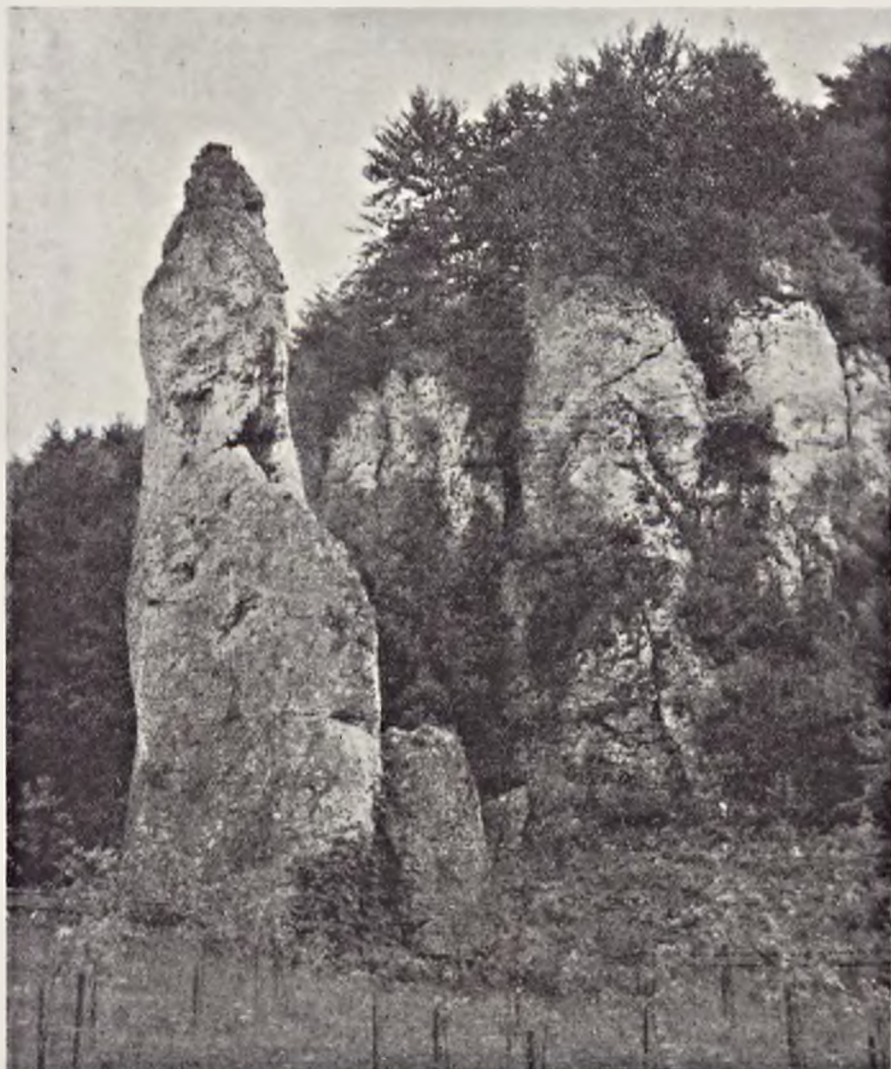
Ryc. 120. Otoczenie „Igły Deotymy” w r. 1962. Widać duże różnice w stosunku do stanu z r. 1930 (por. ryc. 119). Na zrębie i na płaszczyznach skalnych zregenerował się las liściasty (grąd) i ciepłe zarośla. Murawy naskalne z kostrzewą bładą na stromych ścianach pozostały bez widocznych zmian