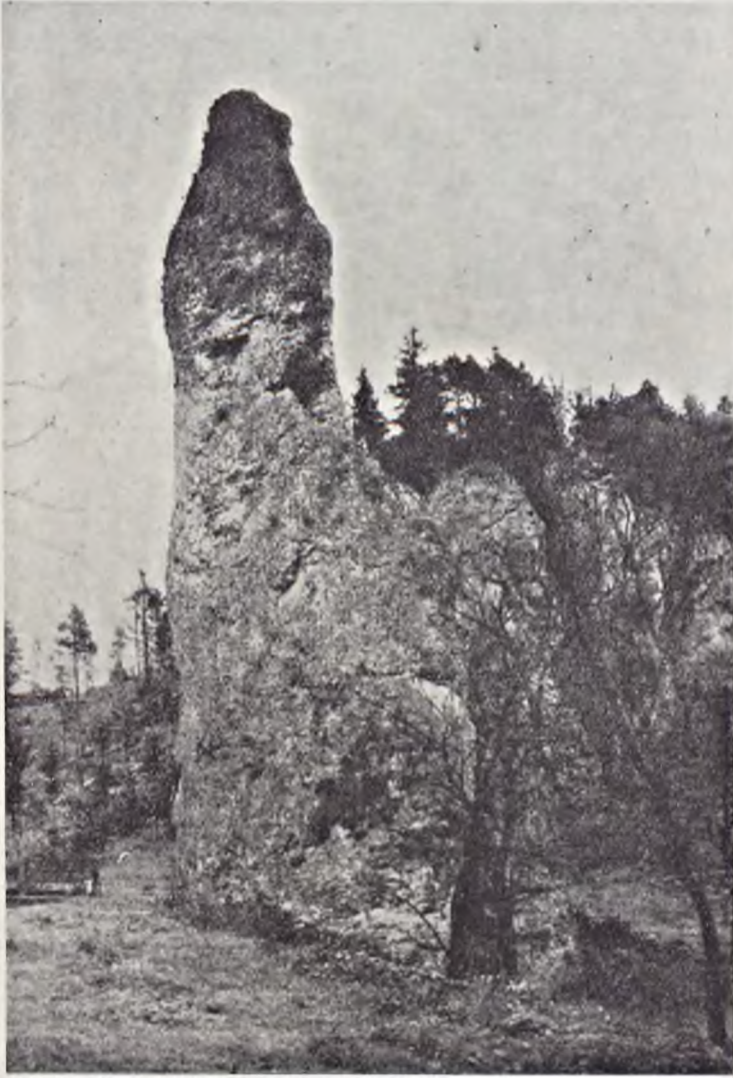
Ryc. 119. Otoczenie „Igły Deotymy” w Dolinie Ojcowskiej przed utworzeniem parku narodowego (r. 1930)