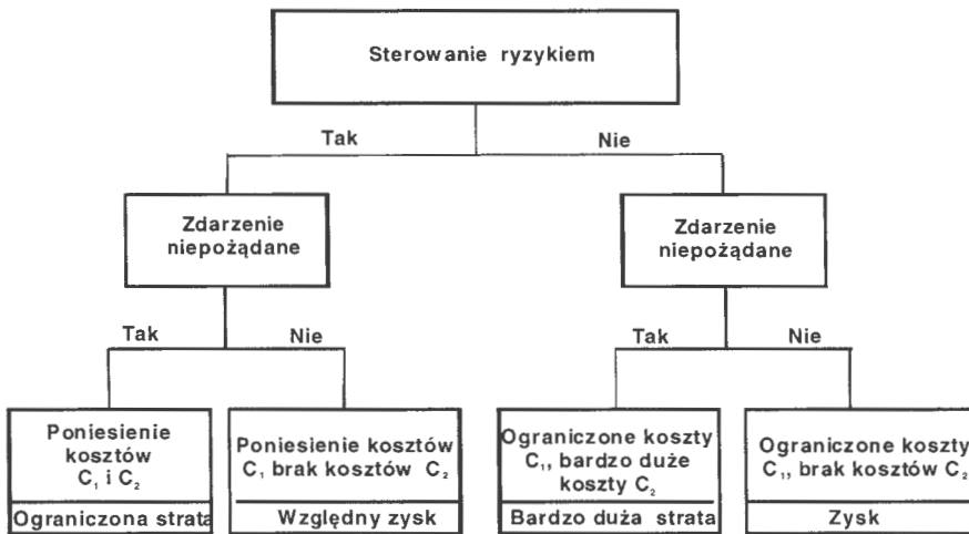
Rys. 10. Scenariusze decyzyjne związane ze sterowaniem ryzykiem.

Na rysunku 10 pokazano możliwe scenariusze decyzyjne.