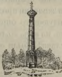
Памятникъ на Бородинскомъ полѣ.

Наступившіе осенніе холода еще болѣе усилили бѣдствія французовъ и привели Наполеона къ окончательному убѣжденію въ невозможности оставаться долѣе въ Москвѣ.