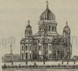
Храмъ Христа Спасителя въ Москвѣ.

только-что сумѣла справиться съ непобѣдимымъ дотогѣ завоевателемъ, наводившимъ страхъ на всю Европу.