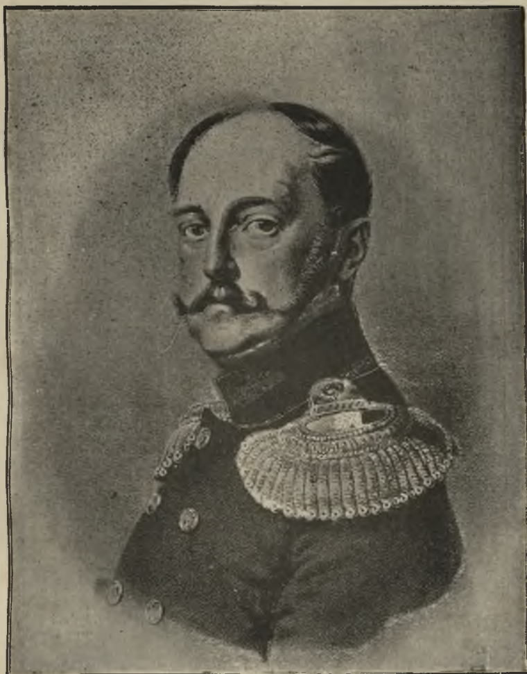
Императоръ Николай I. http://rcin.org.pl