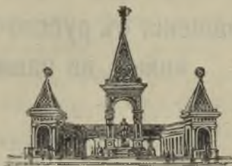
Памятникъ Императору Александру II въ Москвѣ.

Предвкусная свиданіе съ родными, Литовцы впередъ знали, что разказовъ о славномъ подвигѣ родного полка и товарищей подъ Карагачемъ у нихъ хватить на много вечеровъ.