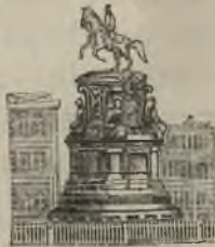
Памятникъ Императору Николаю I въ Петербургѣ.

Слухи объ оставленіи Варшавы и походѣ въ Петербургъ наконецъ подтвердились приказомъ, назначавшимъ выступленіе на 28 октября. Радостное чувство, овладѣвшее всѣми, ясно свидѣтельствовало, что польская столица покидается безъ особаго сожалѣнія.