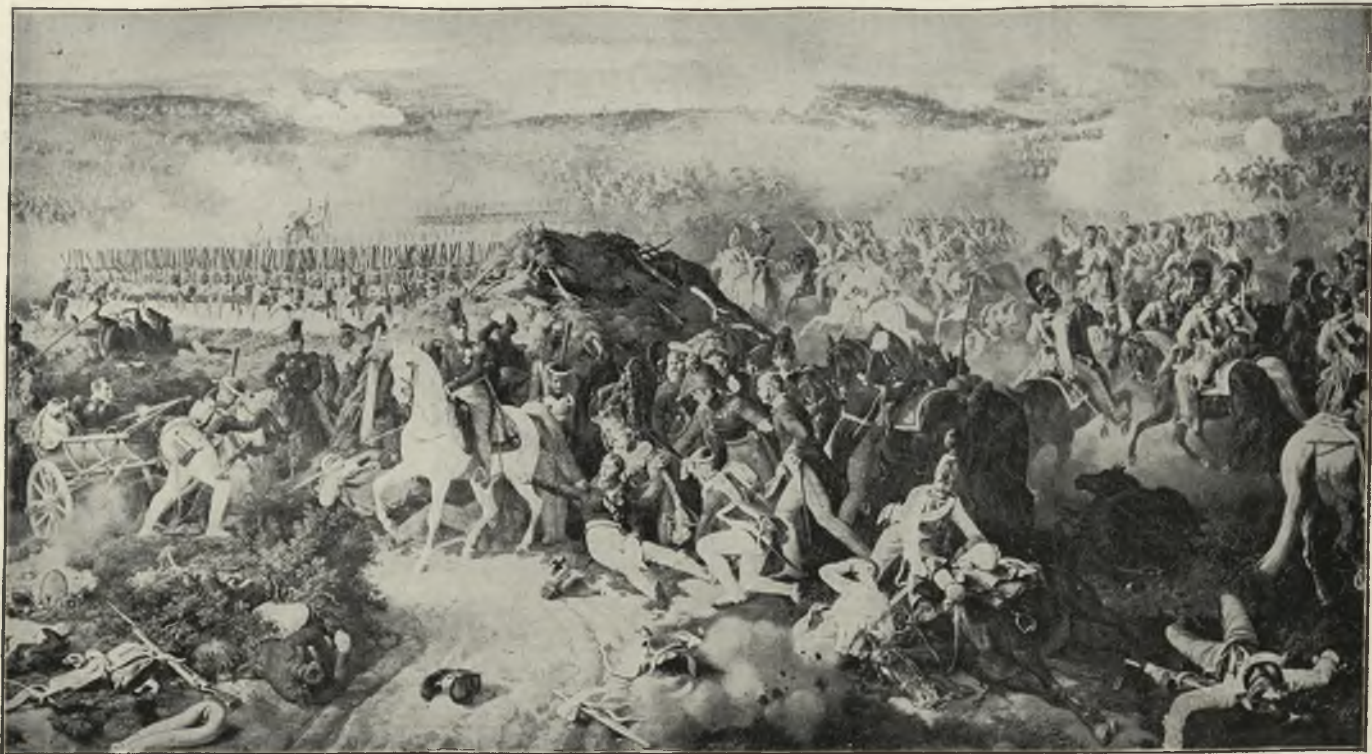
Бородинская битва 26 Августа 1812 года.

Лейбъ Гвардіи Литовскій полкъ отражаетъ атаки французской конницы безъ выстрѣловъ, держа ружья у ноги.