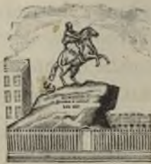
Памятникъ Императору Петру Великому въ Пе- тербургѣ.

Такъ къ 1812 году, т.-е. всего за одиннадцать лѣтъ, она увеличилась на сто тридцать тысячъ человѣкъ, и общая численность ея къ этому времени дошла до шестисотъ пятидесяти тысячъ.