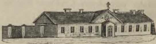
Старая полковая церковь.

Торжество полкового праздника (онъ-же и храмовой) начинается всегда съ молебна, послѣ котораго бываетъ парадъ въ присутствіи всего высшего начальства. Многіе Великіе Князья удостоиваютъ въ этотъ день Лейбъ Гвардіи Литовскій полкъ своими поздравленіями; не забываютъ его и другіе Гвардейскіе полки. Про бывшихъ же Литовцевъ и говорить нечего: со всѣхъ концовъ нашего необъятнаго отечества летятъ отъ нихъ привѣтствія, поздравленія и пожеланія процвѣтанія и славы родному полку.