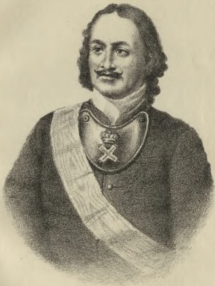
Императоръ Петръ Великій