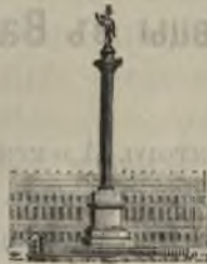
Памятникъ импера- тору Александру I въ Петербургѣ.

тальона, пополненнаго, согласно Высочайшей волѣ, лучшими офицерами и нижними чинами 1 и 2 батальоновъ и оставленнаго въ Варшавѣ.