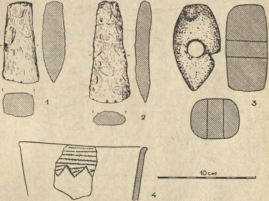
Ryc. 2. Teresin, pow. Proszowice. Zabytki z grobu kultury ceramiki sznurowej:

lone jak okaz z Teresina. Układ szkieletu i jego orientacja nie odbiega od zasad stosowanych przez ludność krakowskiej grupy kultury ceramiki sznurowej. Położenie grobu w Teresinie potwierdza dotychczasowe spostrzeżenia, że na ogół groby w grupie krakowskiej usytuowane są na grzbietach wzniesień lub na ich zboczach. W przeciwieństwie jednak do innych stanowisk grobowych tej grupy kulturowej położonych na wzniesieniach w pobliżu dolin rzecznych lub większych potoków, grób w Teresinie oddalony jest stosunkowo znacznie od najbliższej rzeki, Szreniawy, a także jej mniejszych dopływów.