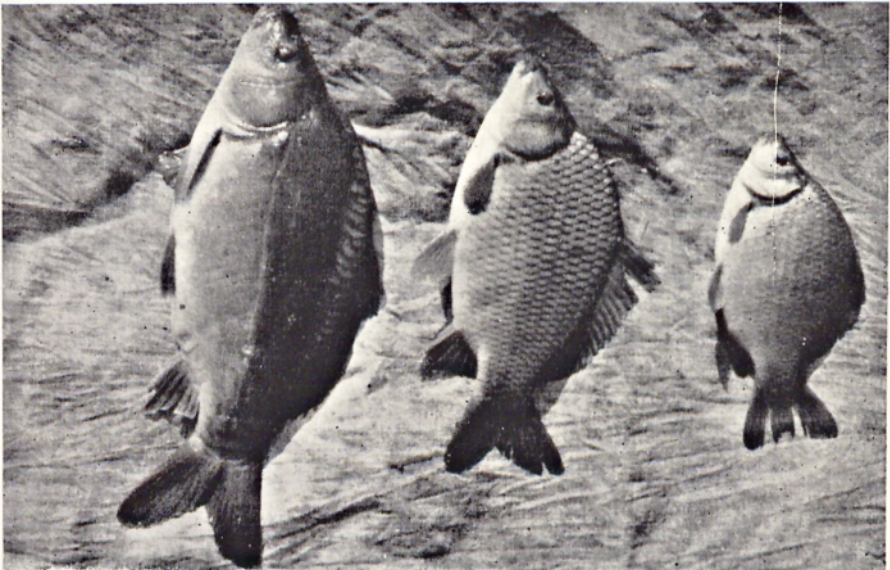
Abb. 2. Von links: Zweijährige Karpfen, Karpfkarasche, und Karasche aus dem Teiche Cegielnia, Teichwirtschaft Landek; 11. X. 1961.