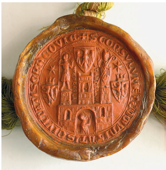
Il. 2. Pieczęć wielka miasta Krakowa przy dokumencie z 27 II 1425; AGAD, dok. perg. nr 5024

na tarczy dokonał Zenon Piech 43 . Badacz słusznie zauważył, że herb w kodeksie nie jest tożsamy z rzeczywistym herbem miasta Krakowa, który do końca XVI w. ukazywał fragment czerwonego muru miejskiego o trzech basztach i otwartej bramie w srebrnym polu. Godło na tarczy herbowej w kodeksie Baltazara Behema nawiązuje natomiast bezpośrednio do przedstawienia w polu wielkiej pieczęci miasta Krakowa, powstałej jeszcze w drugiej połowie XIII w. i poddanej modyfikacjom na początku XIV w. Na pieczęci przedstawiono fragment muru miejskiego z trzema basztami i otwartą bramą, w której kłęczy lub stoi zakapturzony orant, zwracając się w geście modlitewnym do św. Stanisława, ustawionego na lewej heraldycznie baszcie. Na prawej baszcie stoi św. Wacław. Nad środkową wieżą unosi się tarcza z nieukoronowanym orłem, prawdopodobnie herbem Bolesława Wstydlwego. Po bokach muru znajdują się dwie tarcze z herbem Leszka Czarnego, połuorłem-połulwem, nakryte koronami. Po lewej i prawej stronie u góry pola pieczęci widnieją dwie sześcioramienne gwiazdy. Jedyna poważna różnica w treści przedstawień w kodeksie i na pieczęci polega na tym, że w kodeksie lewy (heraldycznie) połuorzeł-połulwem został zastąpiony dwugłowym czarnym orłem.