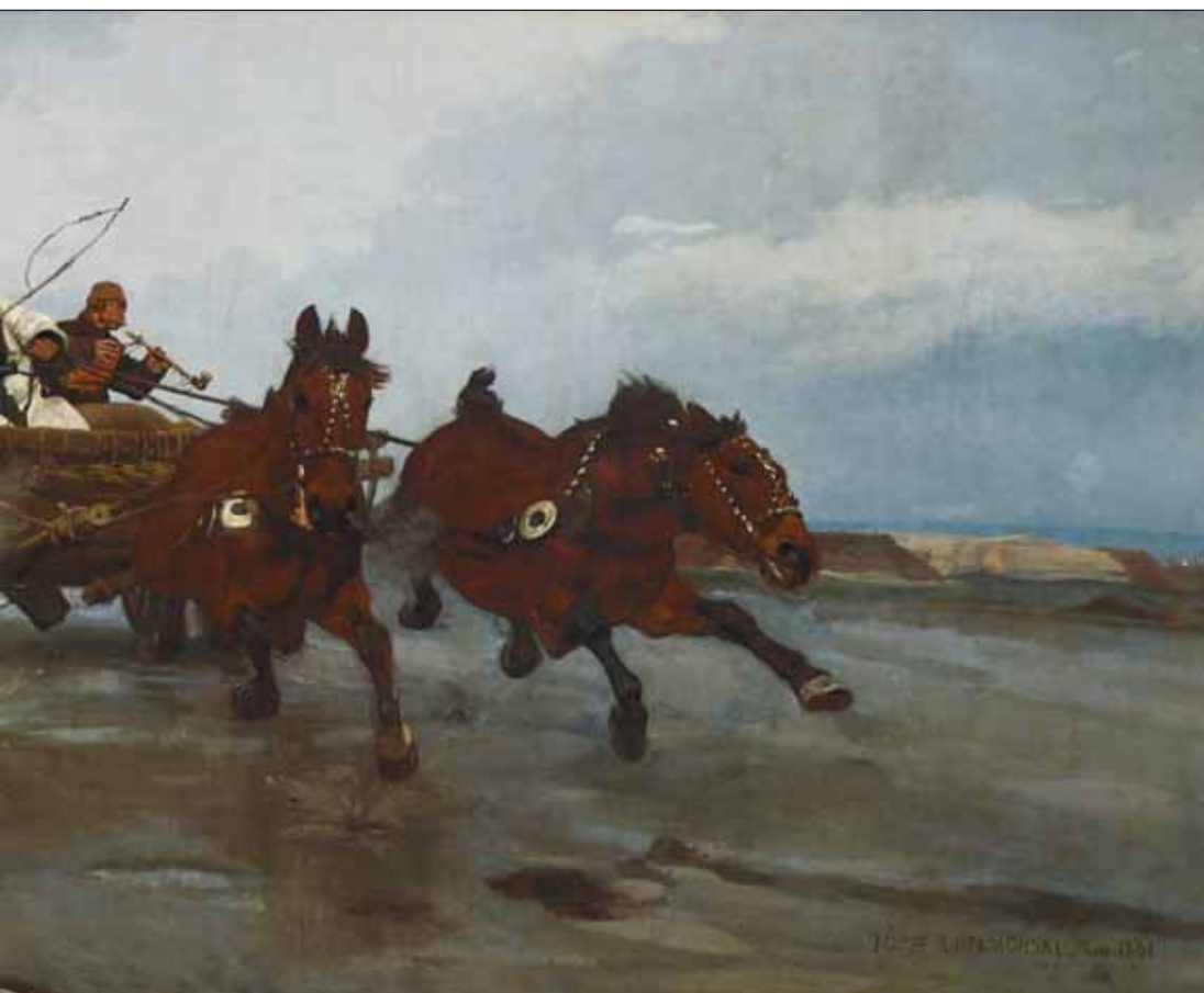
Ryc. 1. Józef Chełmoński, Czwórka , 1881 r., w zbiorach Muzeum Narodowego w Krakowie (nr inw. MNK II-a-258)

Fig. 1. Józef Chełmoński, Four-in-hand , 1881, in the collection of the National Museum in Cracow (inventory no. MNK II-a-258)