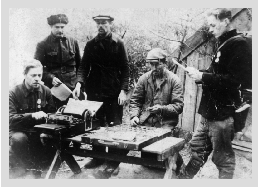
2. Partyzancka drukarnia, NARB, f. 1487, op. 1, sp. 165, k. 3.

Po wznowieniu wydawania pisma na początku 1943 r., zaczęło się ono ukazywać jako organ prasowy KC i Mińskiego Komitetu Miejskiego KP(b)B. Gazetę drukowano w obwodzie mińskim w rejonie kontrolowanym przez partyzantów. Wydawano regularnie aż do wyzwolenia Mińska na początku lipca 1944 r.