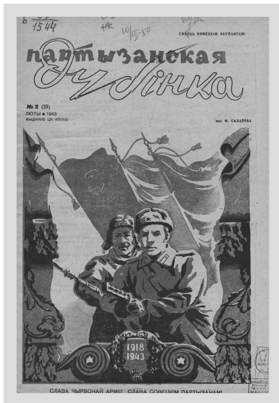
7. „Partyzancki Kij” (II 1943), nr 2 (18).

tysięcy Białorusinów, którzy znaleźli się w strukturach niemieckiej władzy okupacyjnej jako urzędnicy, nauczyciele, policjanci, dziennikarze, pracownicy kultury. Na przekór niemieckiej propagandzie przekonywano, że klęska III Rzeszy jest nieuchronna i wkrótce nadejdzie czas rozliczeń z wykonania obowiązków wobec sowieckiej ojczyzny.