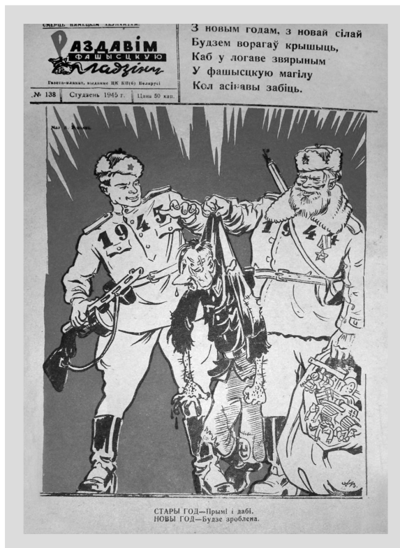
5. „Zmiażdżymy faszystowskiego gada” (I 1945), nr 138.

Na przełomie 1944 i 1945 r. Armia Czerwona wyzwoliła wszystkie okupowane obszary ZSRR i zmierzała w kierunku granic niemieckich. Na plakacie Stary Rok 1944 przekazuje obdartego osobnika z wizerunkiem podobnym do Hitlera z życzeniem „Weż i dobij”. Nowy Rok 1945 odpowiada: „Będzie zrobione” 40 .