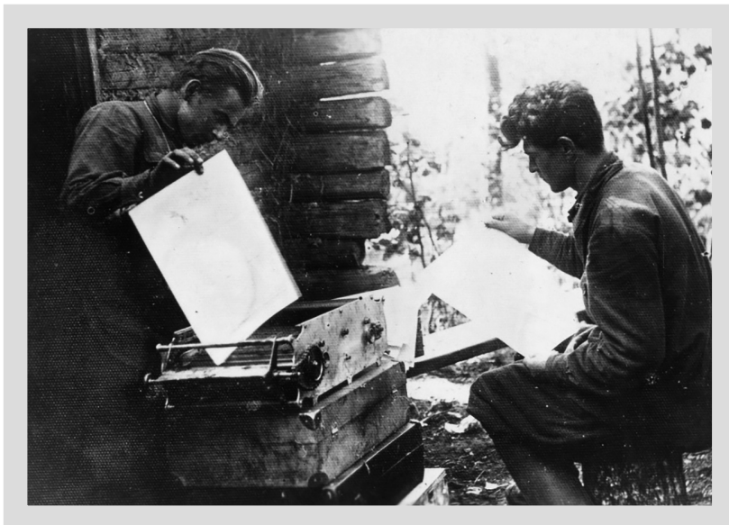
9. Poligrafia Czerwieńskiego Komitetu Rejonowego KP(b)B, maj 1943 r., NARB, f. 1487, op. 1, sp. 165, k. 2.

do państwa radzieckiego na okupowanych obszarach nadano taką samą rangę, jak działalności dywersyjnej.