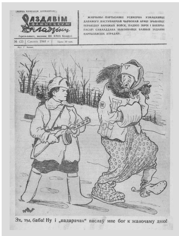
4. „Zmiażdżymy faszystowskiego gada” (III 1944), nr 123.

Publikowane rysunki i hasła dopasowywano do zmieniającej się rzeczywistości. W końcu 1943 r. wynik wojny na wschodzie był możliwy do przewidzenia. Gazeta-plakat z grudnia 1943 r. zapowiadała wymiatanie faszystowskiego śmiecia z Białorusi. Dopełnienie stanowiła informacja od I sekretarza KC KP(b)B Ponomarienki o ponad 120 000 wyeliminowanych przez białoruskich partyzantów żołnierzy niemieckich, 3000 oficerów, w tym 13 generałów, zniszczonych 1079 składach pociągów i 259 czołgach oraz 205 zestrzelonych samolotach. Wielkie sprzątanie „żelazną miotłą” miało nastąpić wraz z nadejściem Armii Czerwonej 38 .