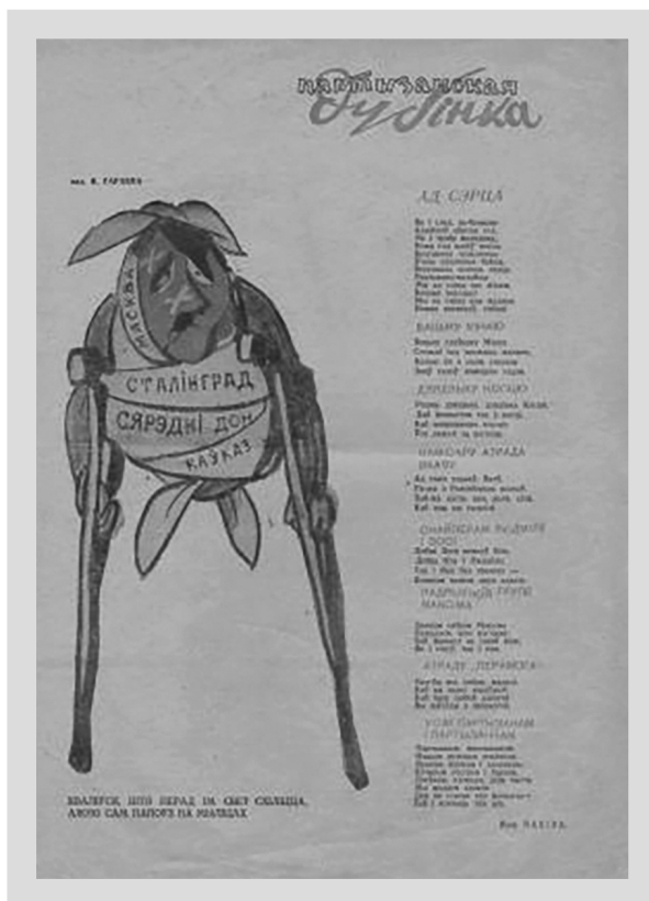
8. „Partyzancki Kij” (III 1943), nr 19.

warunkach wraz drukarzami i specjalistami od propagandy 47 . Dzięki temu możliwe było uruchomienie podziemnych wydawnictw nie tylko szczebla obwodowego, lecz także rejonowego.