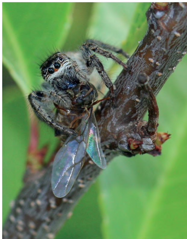
Ryc. 3. Młodociany osobnik strojnisza nadobnego z ofiarą – uskrzydłoną samicą mrówki (poligon Świętoszów, 7.07.2014 r.;)

Występowanie strojnisza nadobnego jest związane przede wszystkim z dostępnością właściwych środowisk. Pająk ten, jak większość skakunowatych, ma zapewne duże zdolności do kolonizowania nowych terenów, co odróżnia go od niektórych, innych pająków objętych ochroną, np. trzech gatunków gryzieli ( Atypus sp.; Atypidae) czy poskocza krasnego Eresus kollari (Eresidae; od 6.10.2014 r. już tylko pod ochroną częściową).