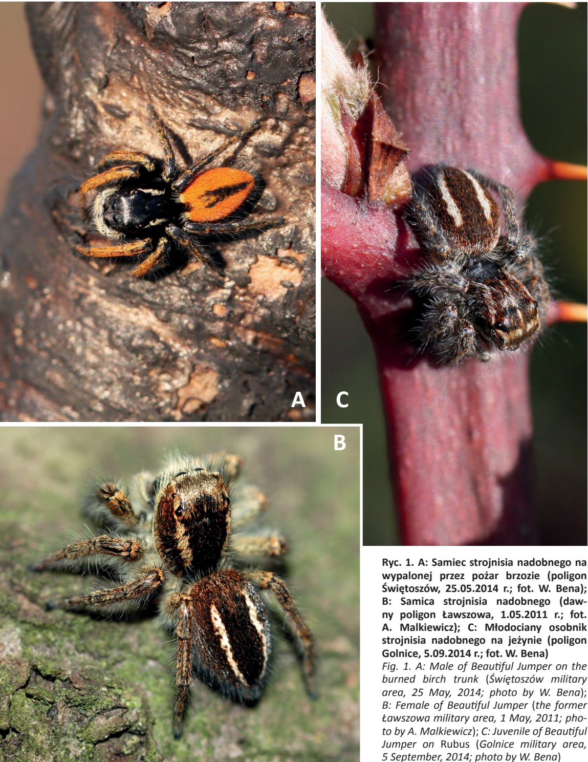
Ryc. 1. A: Samiec strojnisia nadobnego na wypalanej przez pożar brzozie (poligon Świętoszów, 25.05.2014 r.;); B: Samica strojnisia nadobnego (dawny poligon ławszowa, 1.05.2011 r.;); C: Młodociany osobnik strojnisia nadobnego na jeżynie (poligon Golnice, 5.09.2014 r.;)

Fig. 1. A: Male of Beautiful Jumper on the burned birch trunk (Świętoszów military area, 25 May, 2014;); B: Female of Beautiful Jumper (the former ławszowa military area, 1 May, 2011;); C: Juvenile of Beautiful Jumper on Rubus (Golnice military area, 5 September, 2014;)